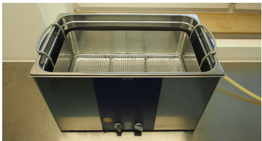
Abb. 1: Vorbereitete Ultraschallbad-Wanne.