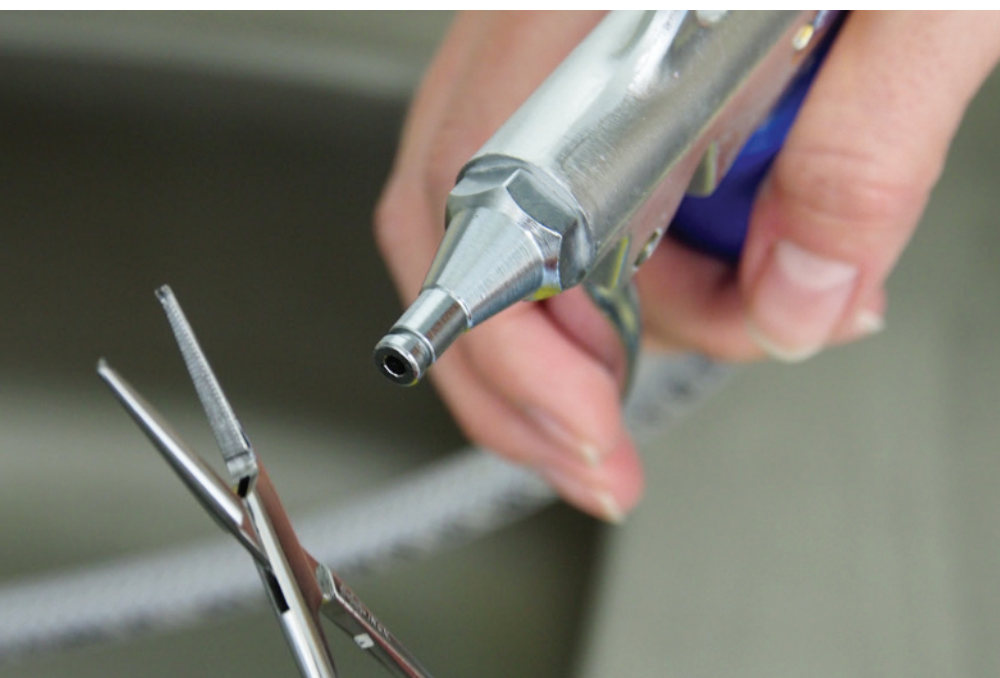
Abb. 2: Trocknung des Instruments mittels Druckluftpistole.

lösung sind die gleichen Vorkehrungen zu treffen, wie beim Ansetzen der Lösung für ein Ultraschallbad. Gleiches gilt für das Vorgehen beim Wechsel der Reinigungslösung. Die Instrumente müssen vollständig in das Instrumentenbecken eingelegt werden und dürfen nicht übereinander liegen. Reinigen Sie die Instrumente mit entsprechenden Reinigungsbürsten unterhalb der Flüssigkeitsoberfläche, um ein Verspritzen kontaminierter Flüssigkeit zu vermeiden. Konsultieren Sie vorab Ihren Instrumentenhersteller, welche Bürsten für die Reinigung der Instrumente zum Einsatz kommen können, um Schäden zu vermeiden. Beim Einsatz solcher Bürsten sollten Sie darauf achten, dass diese desinfizierbar sind, alternativ können Einmalbürsten verwendet werden. Die äußeren Oberflächen der Instrumente werden anschließend mit einem weichen, fusenfreien Tuch oder der Bürste gereinigt. Beim Reinigen von Instrumenten mit Lumina oder Arbeitskanälen sollten Sie diese mit einer Einwegspritze luftblasenfrei durchspülen, um Sekrete, Gewebereste oder Bohrmehl aus den Hohlräumen zu entfernen. Zur mechanischen Bürstenreinigung von Hohlräumen führen Sie die Reinigungsbürste in das distale Ende des Instruments ein und schieben es bis zur proximalen Öffnung durch. Bewegen Sie die Bürste auf und ab, um sämtlichen Schmutz zu eliminieren. Wiederholen Sie diesen Vorgang so oft, bis die Bürste frei von Verunreinigungen ist.