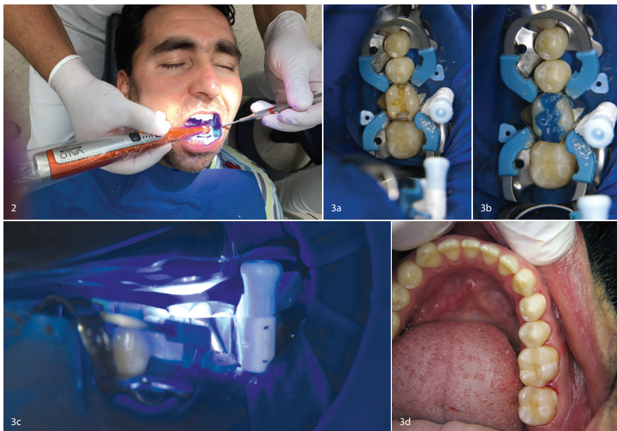
Abb. 2: Für die Aushärtung lichthärtender Kunststoffe nutzt der Zahnarzt seit zehn Jahren die VALO™ Polymerisationsleuchten (Ultradent Products), u.a. die VALO™ Grand Polymerisationsleuchte mit einer 50 Prozent größeren Ausleuchtungsfläche. Abb. 3a–d: Die Anwendung der VALO™ Grand Polymerisationsleuchte gelingt einfach und komfortabel für Anwender und Patient mit überzeugendem Ergebnis.

größten Vorteile aufgezählt, die meine Kolleginnen und mich täglich überzeugen. Wir als Behandler haben dadurch einen standardisierten Behandlungsablauf mit einem vorhersagbaren Ergebnis und die Patienten keine Probleme nach einer nicht selten anstrengenden Behandlung.