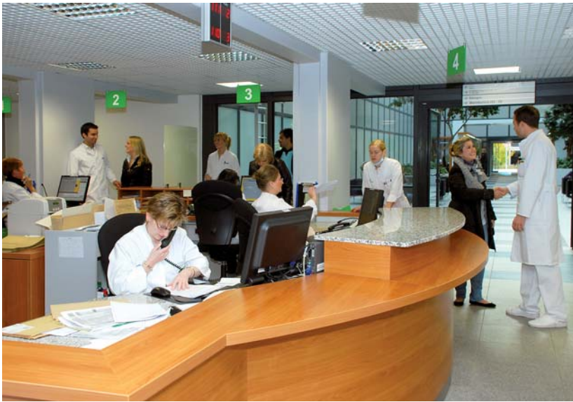
Schalt- und Schnittstelle Empfangsschalter: Das dortige Personal muss über PR-Maßnahmen und die Modalitäten bei Kostennachlässen unbedingt informiert werden, damit Anfragen – z. B. durch Anzeigen ausgelöste Anrufe – nicht ins Leere laufen.