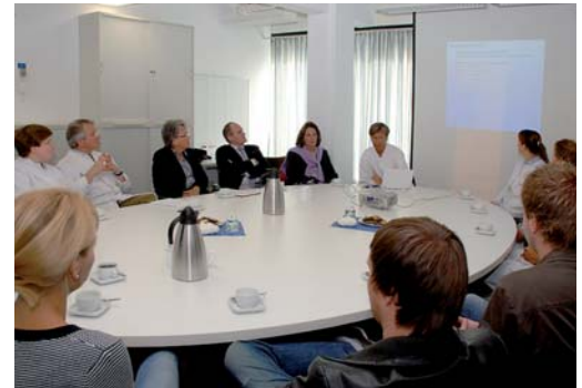
Der runde Tisch sitzt sich an einem ovalen: In regelmäßigen Abständen – etwa alle zwei Monate – kommt die münstersche Initiative zu ihren Arbeitstreffen zusammen.