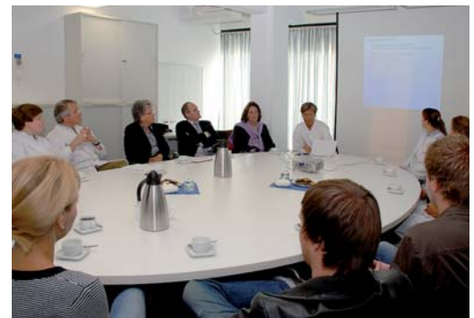
Der runde Tisch sitzt sich an einem ovalen: In regelmäßigen Abständen – etwa alle zwei Monate – kommt die münstersche Initiative zu ihren Arbeitstreffen zusammen.

In der Summe hat das münstersche Maßnahmenpaket – allem voran Anzeigen und Kostennachlässe – zu einer derzeit stabilisierten Situation in der dortigen Studentenbehandlung geführt. Wenn alle Beteiligten an einem Strick ziehen, viel Arbeit, Kreativität und Geld