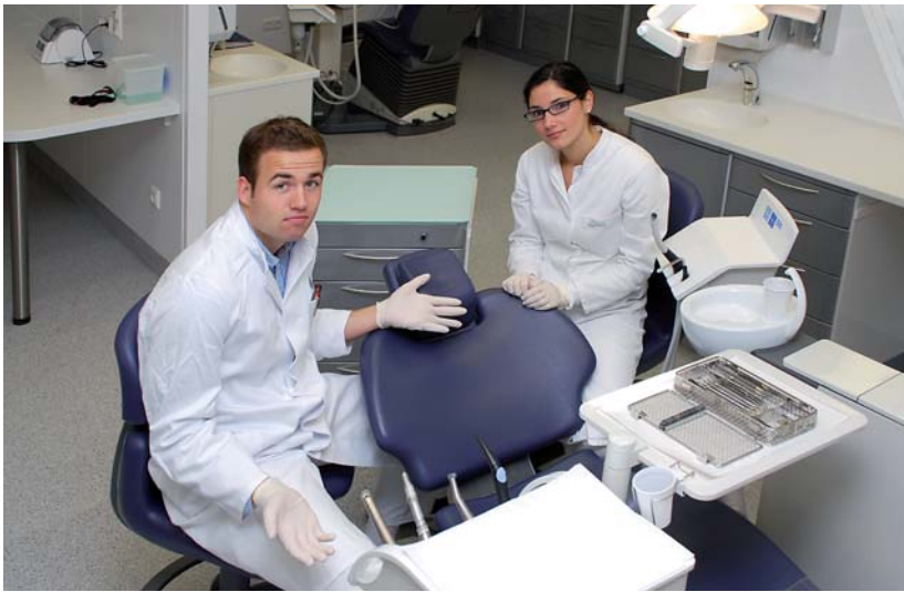
Manchmal bleibt der Behandlungsstuhl leer – vor allem deshalb, weil es bei der Studentenbehandlung ein Image- und Informationsdefizit gibt.