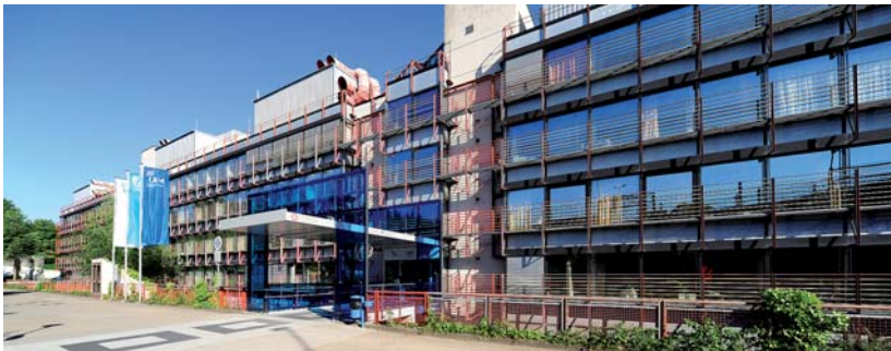
Gebäude der Uni-Zahnklinik in Münster. Eingang und Wartebereich wurden bereits umfassend modernisiert, in anderen Bereichen hat der Umbau begonnen.