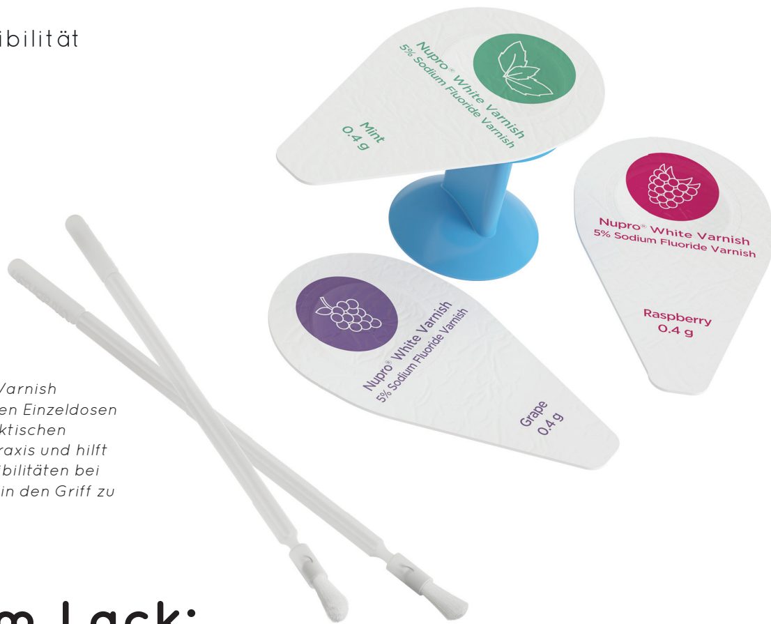
Abb. 1: Nupro White Varnish kommt in hygienischen Einzeldosen sowie mit einem praktischen Fingerhalter in die Praxis und hilft so dabei, Hypersensibilitäten bei einfachem Handling in den Griff zu bekommen.