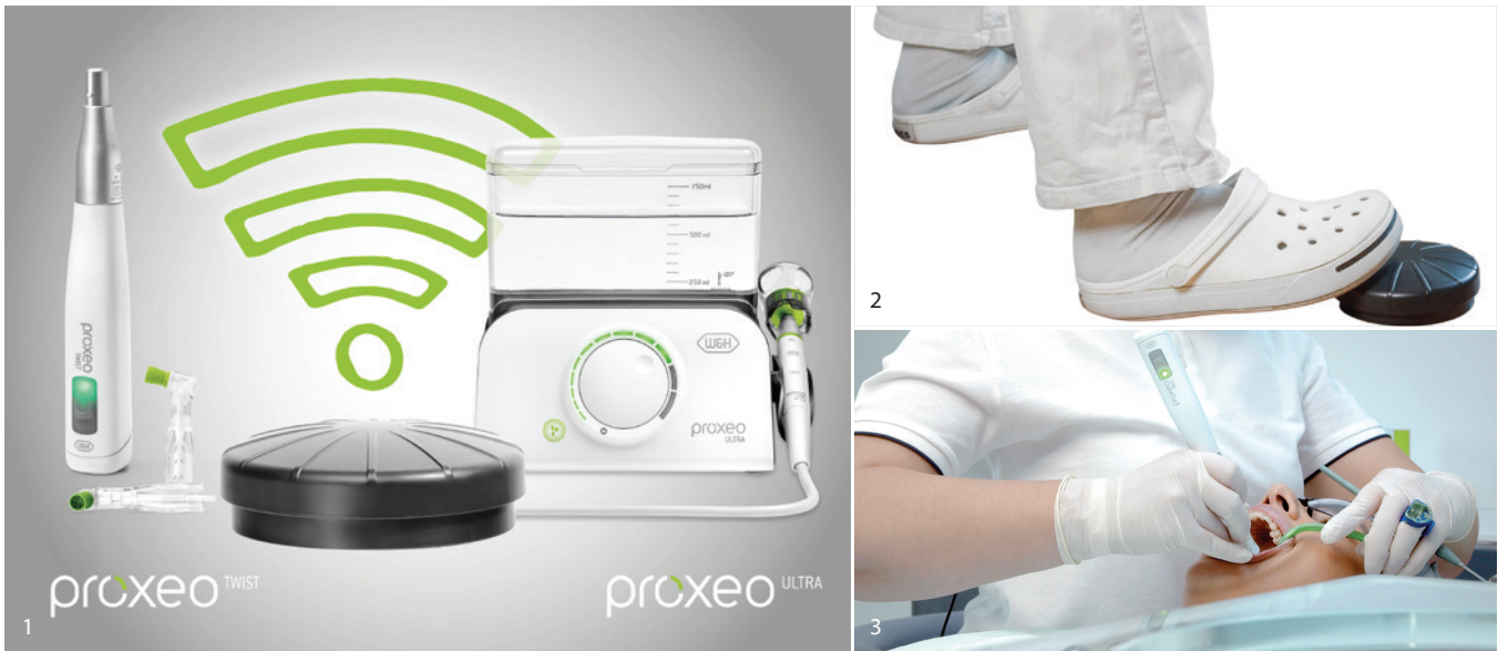
Abb. 1: Eine kabellose Fußsteuerung – zwei Geräte. Abb. 2: Die kabellose Fußsteuerung folgt auf Schritt und Tritt. Abb. 3: Die neue W&H-Prophylaxelösung unterstützt die entspannte Arbeitsweise und sorgt für eine ergonomische Körperhaltung.

Bequem, kabellos und effizient präsentiert sich die neue W&H-Prophylaxelösung. Ab sofort lassen sich der Proxeo Ultra Piezo Scaler PB-530 und das kabellose Proxeo Twist Poliersystem PL-40 H mit nur einer kabellosen Fußsteuerung betätigen. Das erleichtert nicht nur die Bedienung, sondern sorgt auch für mehr Effizienz im Arbeitsablauf. Mit der aktuellen Erweiterung des Prophylaxeportfolios unterstützt W&H eine