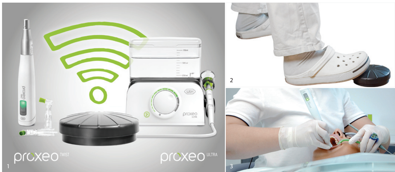
Abb. 1: Eine kabellose Fußsteuerung – zwei Geräte. Abb. 2: Die kabellose Fußsteuerung folgt auf Schritt und Tritt. Abb. 3: Die neue W&H-Prophylaxelösung unterstützt die entspannte Arbeitsweise und sorgt für eine ergonomische Körperhaltung.

Bequem, kabellos und effizient präsentiert sich die neue W&H-Prophylaxelösung. Ab sofort lassen sich der Proxeo Ultra Piezo Scaler PB-530 und das kabellose Proxeo Twist Poliersystem PL-40 H mit nur einer kabellosen Fußsteuerung betätigen. Das erleichtert nicht nur die Bedienung, sondern sorgt auch für mehr Effizienz im Arbeitsablauf.