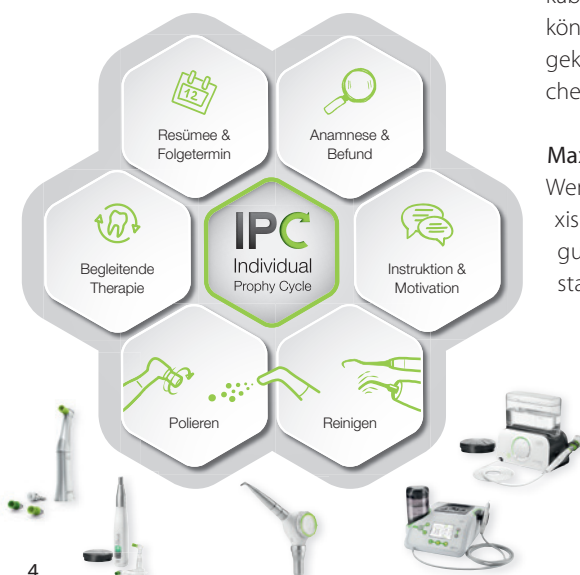
Abb. 4: Der IPC (Individual Prophy Cycle) von W&H ermöglicht eine fallorientierte Anleitung für die Prophylaxebehandlung. Das neue Prophylaxesystem sorgt mit nur einer Fußsteuerung für noch mehr Effizienz beim Arbeitsablauf.

Sind in der Praxis bereits entsprechende Prophylaxegeräte von W&H vorhanden, so können diese auf das neue System updatet werden. Wenden Sie sich dazu an einen autorisierten W&H-Servicepartner.