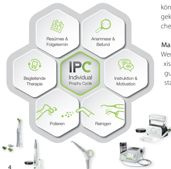
Abb. 4: Der IPC (Individual Prophy Cycle) von W&H ermöglicht eine fallorientierte Anleitung für die Prophylaxebehandlung. Das neue Prophylaxesystem sorgt mit nur einer Fußsteuerung für noch mehr Effizienz beim Arbeitsablauf.

Weniger Equipment in der Zahnarztpraxis bedeutet mehr Platz sowie Bewegungsfreiheit für den Behandler. Anstatt zwei Fußsteuerungen ist für die