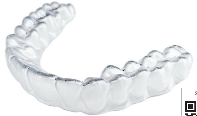
Über die Hälfte der Aligner-Neubehandlungen im dritten Quartal 2020 wurden außerhalb des US-amerikanischen Heimatmarkts von ClearCorrect generiert.

Die Straumann Group meldete ein organisches Umsatzwachstum von 8 Prozent für das dritte Quartal 2020, trotz der Auswirkungen von COVID-19 und des hohen Vergleichswerts aus dem Vorjahr (+19 Prozent). Infolge der soliden Ergebnisse im dritten Quartal konnte das Minus von 19 Prozent im Halbjahresvergleich im Periodenvergleich für die ersten neun Monate auf 11 Prozent verringert werden. Dank des Nachholbedarfs bei restaurativen Eingriffen, Implantatoperationen und Behandlungen mit transparenten Alignern im dritten Quartal sowie des Verkaufserfolgs bei digitalen Geräten belief sich der Nettoumsatz für die ersten neun Monate auf 976 Mio CHF. Das kieferorthopädische Geschäft verzeichnete im 3. Quartal 2020 einen deutlichen Aufschwung, der