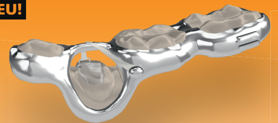
Slider auf Minipin