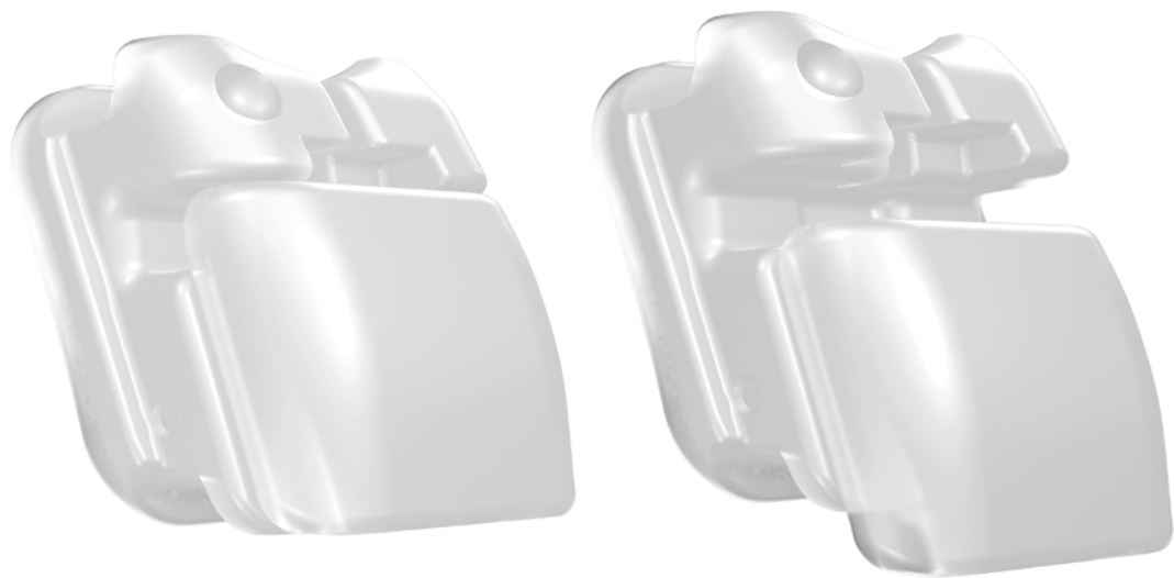
3M Clarity Ultra SL Selbstligierendes Keramikbracket mit zuverlässigem Klappen-Mechanismus.

COVID-19 veranlasst Menschen weltweit dazu, ihre gewohnten Verhaltensweisen zu überdenken und zu verändern – im Alltag ebenso wie im Berufsleben. Auch in kieferorthopädischen Fachpraxen sind Anpassungen erforderlich. So gilt es, zum Schutz aller Beteiligten lange Aufenthalte von Patienten in der Praxis zu vermeiden, die Aerosolbildung auf ein Minimum zu reduzieren und Kreuzkontaminationen durch Apparaturen, Materialien und Equipment vorzubeugen. Tipps und Tricks, wie dies unter Einsatz von 3M Produkten gelingt, enthält diese vierteilige Beitragsserie.