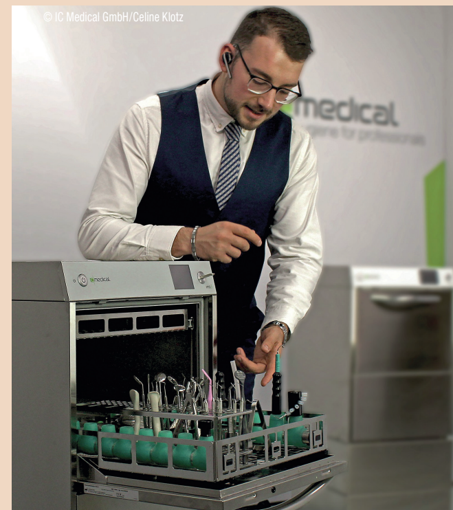
Vor der Kamera: Ein Vertriebsmitarbeiter beim Kundengespräch in der Videobox.

In der „neuen Normalität“ sieht das Unternehmen Messeaktivitäten in neuen Formaten im Kommen. Zu-