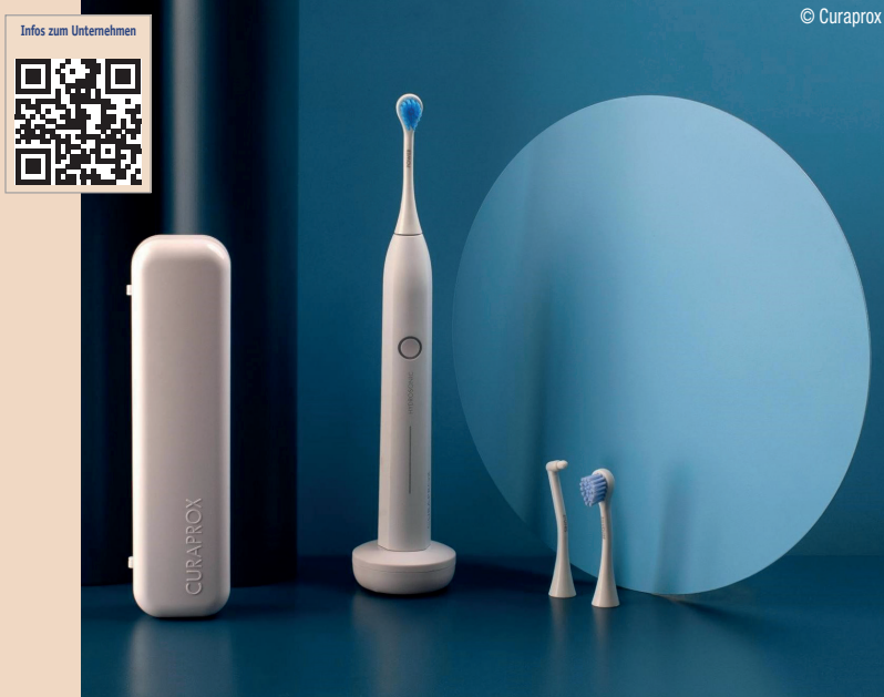
Die Hydrosonic Pro kommt mit drei in der Schweiz hergestellten Top-Bürstenköpfen: power, sensitive und single.

Der Akku ist so stark wie die Hydrosonic Pro sanft ist: 60 Minu-