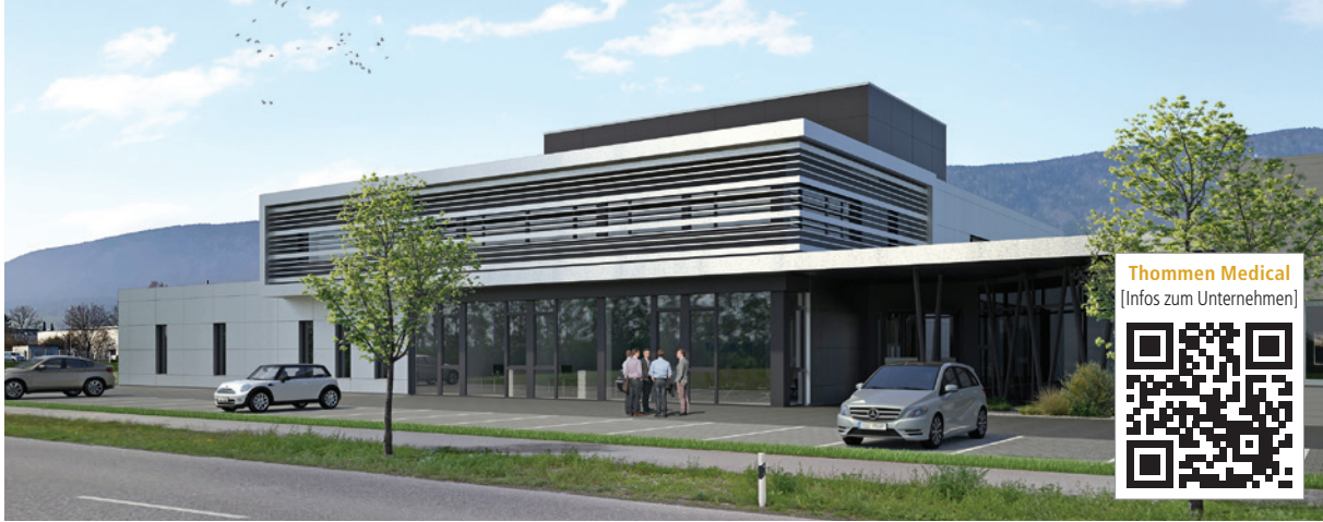
Neues Produktions- und Kundencenter