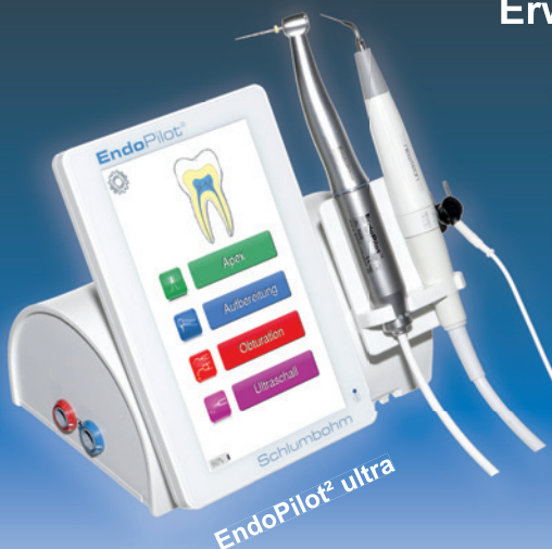
EndoPilot 2 ultra