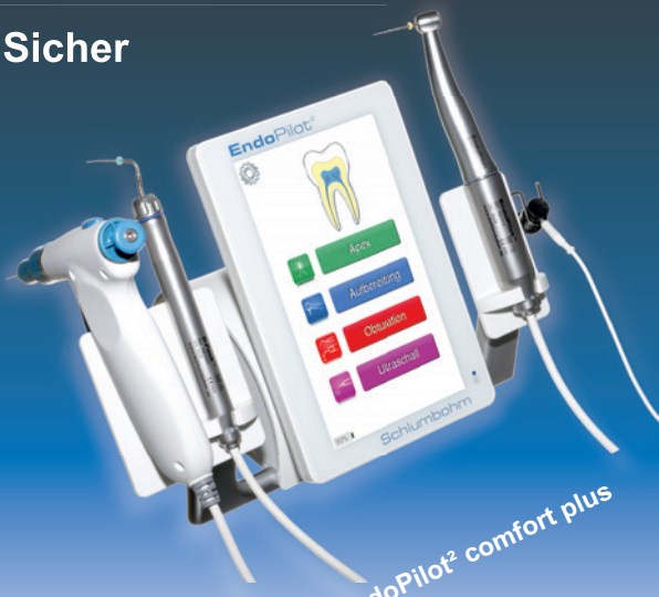
EndoPilot 2 comfort plus