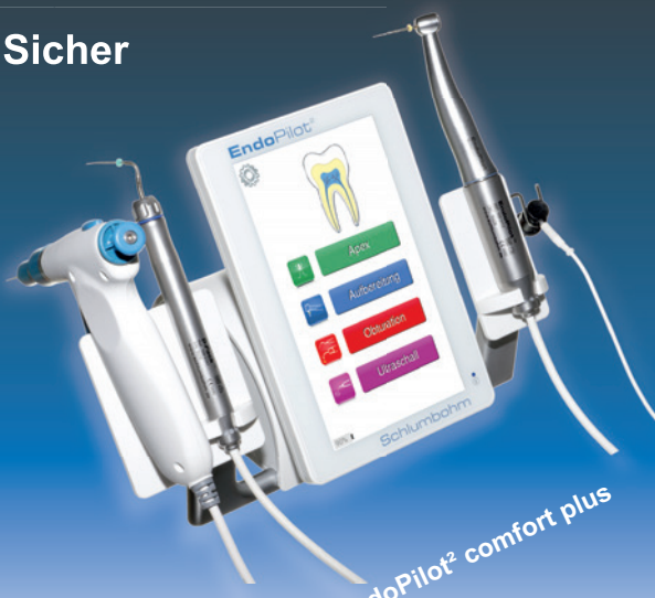
EndoPilot 2 comfort plus