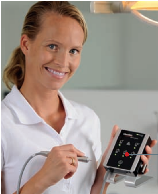
Nur 115 x 90 x 28 mm groß: der claros pico®

„Absolut genial, was elexxion jetzt entwickelt hat.