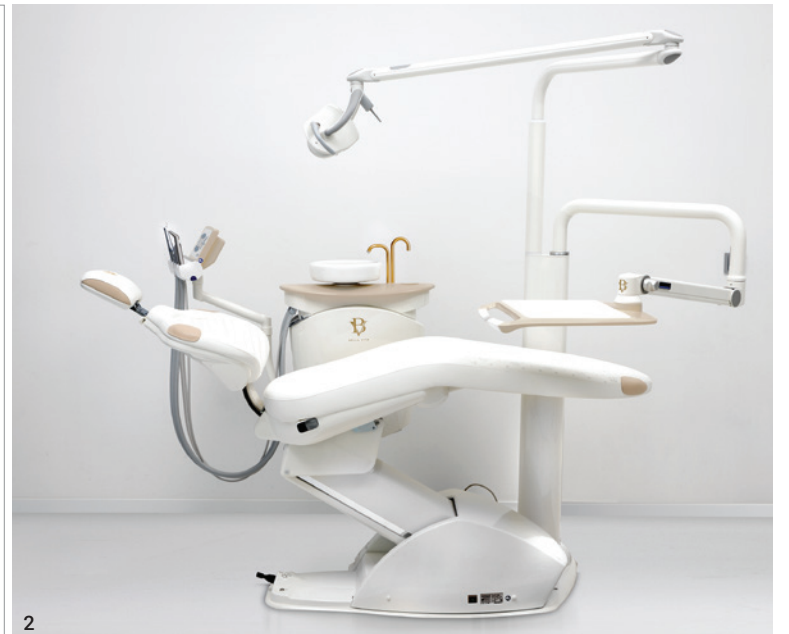
ortho line db