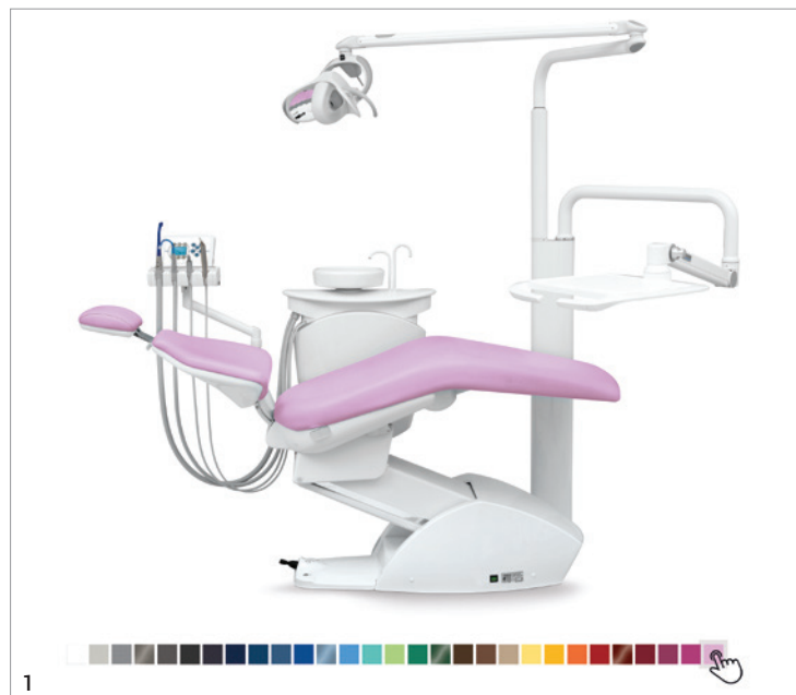
ortho line db