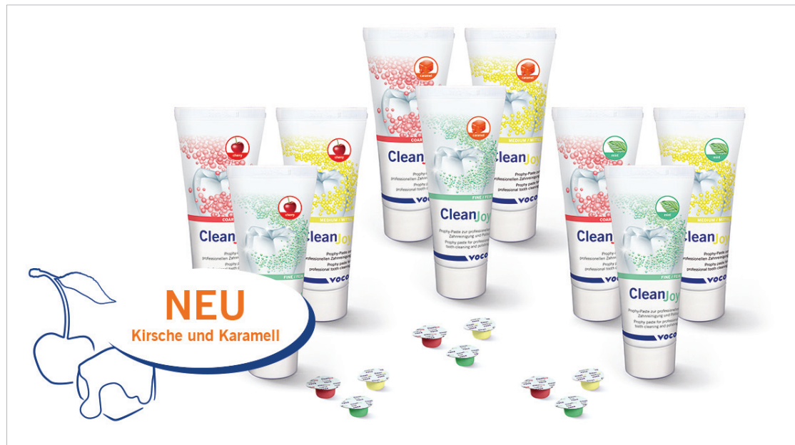
Die Prophylaxepaste CleanJoy von VOCO gibt es nun auch in den Geschmacksrichtungen „cherry“ und „caramel“.

CleanJoy ist in drei unterschiedlichen Reinigungsstärken erhältlich, sodass je nach Grad der Verunreinigung individuell auf die Patientensituation eingegangen werden kann. Dank der farblichen Kennzeichnung der Verpackung und Pasten in Anlehnung an das Ampel-