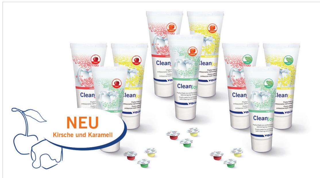
Die Prophylaxepaste CleanJoy von VOCO gibt es nun auch in den Geschmacksrichtungen „cherry“ und „caramel“.

CleanJoy ist in drei unterschiedlichen Reinigungsstärken erhältlich, sodass je nach Grad der Verunreinigung individuell auf die Patientensituation eingegangen werden kann. Dank der farblichen Kennzeichnung der Verpackung und Pasten in Anlehnung an das Ampel-