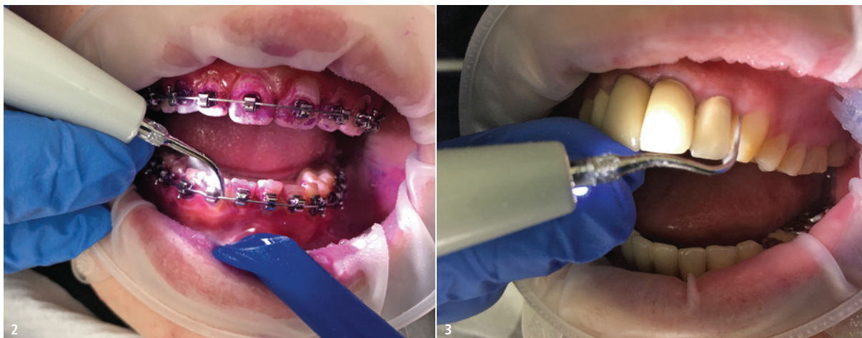
Abb. 2: Anwendung eines graziilen Ultraschallaufsatzes bei einer Multibracket-Apparatur. – Abb. 3: Der Varios Combi Pro im Einsatz in der PZR.