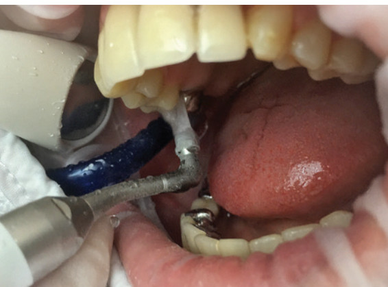
Abb. 5: Geringerer Strahldruck in Kombination mit flexiblen planförmigen Kunststoffspitzen (Perio Nozzle) weisen auf eine einfache Spitzenführung in subgingivalen Bereichen hin.

währte aber zu jeder Zeit die Kontrolle, mit welchem Pulver gerade behandelt wurde. Bei Anschluss des Perio-Systems verringert sich die Strahlkraft gegenüber dem supragingivalen Modul automatisch um 20 Prozent. Geringerer Strahldruck in Kombination mit flexiblen planförmigen Kunststoffspitzen (Nozzle) weisen auf eine einfache Spitzenführung in subgingivalen Bereichen hin (Abb. 5). Auffällig waren hier die vereinfachten Zugänge bei exponierten ZE-Aufbauten oder Implantatkonstruktionen und die freie Sicht durch das schlanke Instrumentendesign. Die Patientenakzeptanz war sehr gut. Soll mit dem glycinbasierten Pulver gleich die supragingivale Oberflächenpolitur erfolgen, bedarf es nur der Entfernung der Einmalspitze und man kann sofort vom subgingivalen auf den supragingivalen Einsatz umstellen.