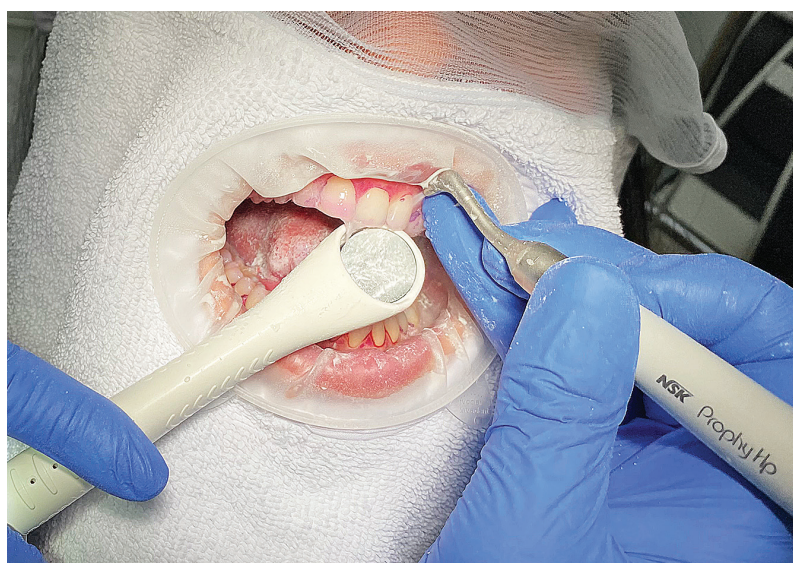
Abb. 4: Entfernung von exogenen Verfärbungen mit dem FLASH pearl Reinigungspulver.

Wurde während einer Patientenbehandlung von supra- auf subgingival gewechselt, musste das komplette System gewechselt werden. Das bedeutet, die Düse (supra) inkl. Pulverkammer (die kalziumbasiertes Pulver oder Natriumbicarbonat enthält) wurden aus der Basisstation entnommen und dafür das Perio-System (Düse, Einmal- Nozzle-Ansätze und Kammer mit glycinbasiertem Pulver) eingesetzt. Das Gerät erkannte sofort den Wechsel und zeigte dies am Display an. Auch das war anfangs gewöhnungsbedürftig, ge-