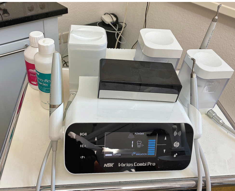
Abb. 1: Das Prophylaxegerät Varios Combi Pro bietet zahlreiche Einsatzmöglichkeiten in der Praxis.

Zunächst kam das Gerät an einem KFO-Patienten mit festsitzender Apparatur zum Einsatz, da der Zugang zum Zahn bzw. Zahnstein hier oft erschwert ist. Die Auswahl an Ultraschallaufsätzen ist groß (Metall oder Kunststoff, diverse Formen, Oberflächen und Stärken). Die Kollegin hat einen grazilen Ansatz gewählt, da die Multiband-Apparatur (ohne vorherige Bogenentfernung) dies erforderte (Abb. 2). Das Feedback der Kollegin war kurz und knapp: schmaler Schaft, gute Sicht durch integrierte LEDs am vorderen Ende und ein sehr gutes Adaptiongsgefühl. Die einfache und visuell kontrollierbare Instrumentenführung ermöglichte eine effiziente Reinigung bei diesem und auch bei den folgenden Patienten, an denen PZR- (Abb. 3) und UPT-Behandlungen mit unterschiedlichen Aufsätzen durchgeführt wurden.