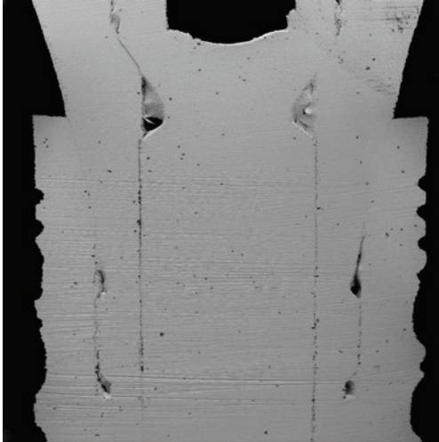
Abb. 13: Abutmentpassung eines BioniQ® Implantats (REM-Aufnahme, 100-fach).

riert (BioniQ® Plus, LASAK) und gleichzeitig der posteriore Bereich intrasinusal mit einem Gemisch aus Eigenknochen und TCP augmentiert (Abb. 2–4). Die Auswahl dieses Implantattyps berücksichtigte dabei die ästhetischen Besonderheiten des oberen Seitenzahnbereichs. Eigenknochen wurde in der chirurgischen Sitzung mit einem Safescraper an der bukkalen Kieferhöhlenwand entnommen und in einer „ersten Schichtung“ periimplantär in 27 eingebracht. Weiter bukkal in Richtung der aufgelagerten Kollagenmembran (Collagene AT®, Vertrieb LASAK) wurde Tricalciumphosphat mit einer Korngröße von 0,6–1 mm platziert (PORESORB-TCP, LASAK). Implantatselektion und -durchmesser ermöglichten eine spätere Brückenversorgung; der maschinelle Hals sorgte im Seitenzahnbereich für eine langfristig stabile parodontale Situation.