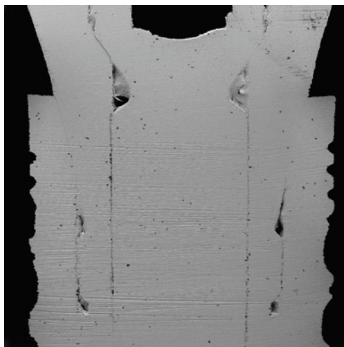
Abb. 13: Abutmentpassung eines BioniQ® Implantats (REM-Aufnahme, 100-fach).

riert (BioniQ® Plus, LASAK) und gleichzeitig der posteriore Bereich intrasinusal mit einem Gemisch aus Eigenknochen und TCP augmentiert (Abb. 2–4). Die Auswahl dieses Implantattyps berücksichtigte dabei die ästhetischen Besonderheiten des oberen Seitenzahnbereichs. Eigenknochen wurde in der chirurgischen Sitzung mit einem Safescraper an der bukkalen Kieferhöhlenwand entnommen und in einer „ersten Schichtung“ periimplantär in 27 eingebracht. Weiter bukkal in Richtung der aufgelagerten Kollagenmembran (Collagene AT®, Vertrieb LASAK) wurde Tricalciumphosphat mit einer Korngröße von 0,6–1 mm platziert (PORESORB-TCP, LASAK). Implantatselektion und -durchmesser ermöglichten eine spätere Brückenversorgung; der maschinelle Hals sorgte im Seitenzahnbereich für eine langfristig stabile parodontale Situation.