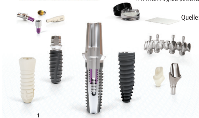
Abb. 1: patient28PRO ist die umfangreiche Garantie für Ihre Implantatversorgung. Im Falle eines Implantatverlusts steht das komplette BioHorizons Camlog Portfolio inkl. Knochenaugmentationsmaterialien für eine Neuversorgung zur Verfügung. Bildquelle: CAMLOG – Abb. 2: patient28PRO umfasst nun auch Knochenaugmentationsmaterialien – ein Grund mehr, die BioHorizons Camlog Biomaterialien zu lieben.