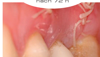
Klinische Bilder mit freundlicher Genehmigung von Prof. Pilloni, Italien. Individuelle Ergebnisse können abweichen.