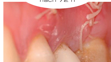
Klinische Bilder mit freundlicher Genehmigung von Prof. Pilloni, Italien. Individuelle Ergebnisse können abweichen.