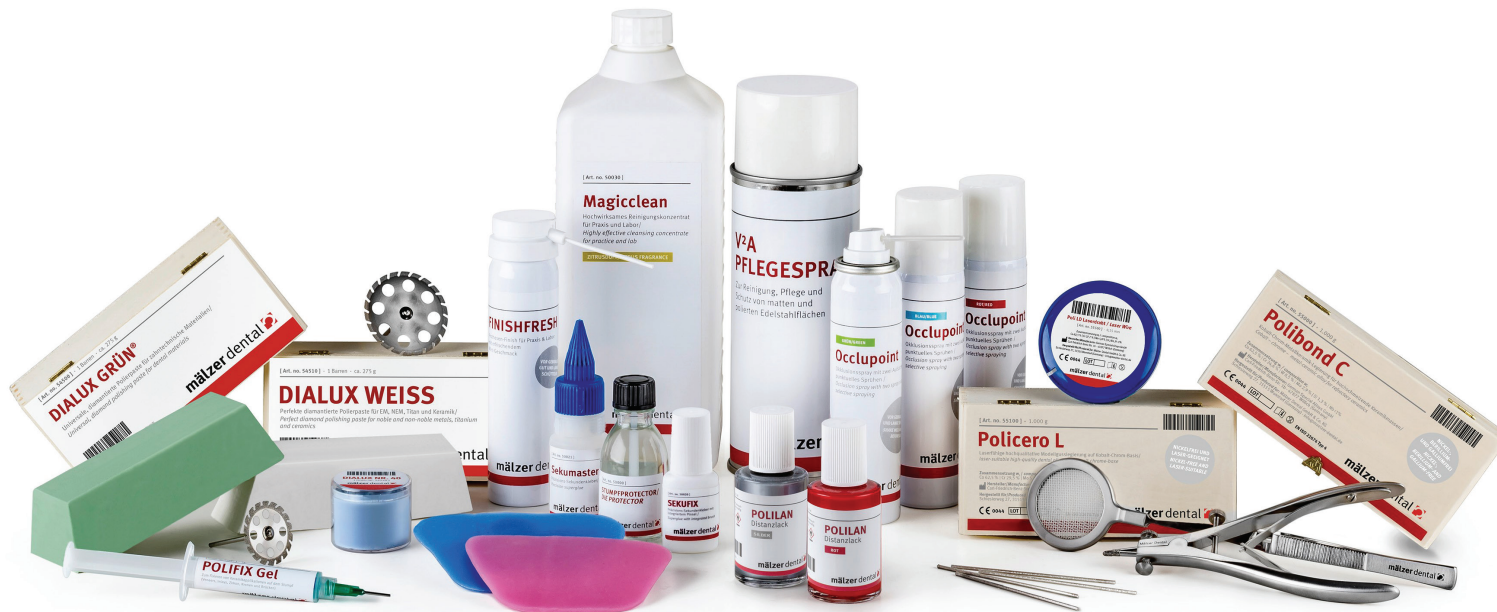
© Mälzer Dental GmbH & Co. KG

Das vereinte Produkortiment rundet das gesamte Angebot ab.