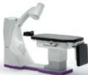
SkyView 3D CBCT panoramic imager