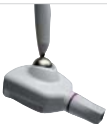
RXDC HyperSphere High frequency X-ray unit