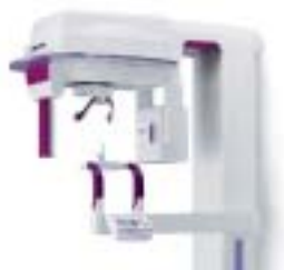
Hyperion Panoramic Imager