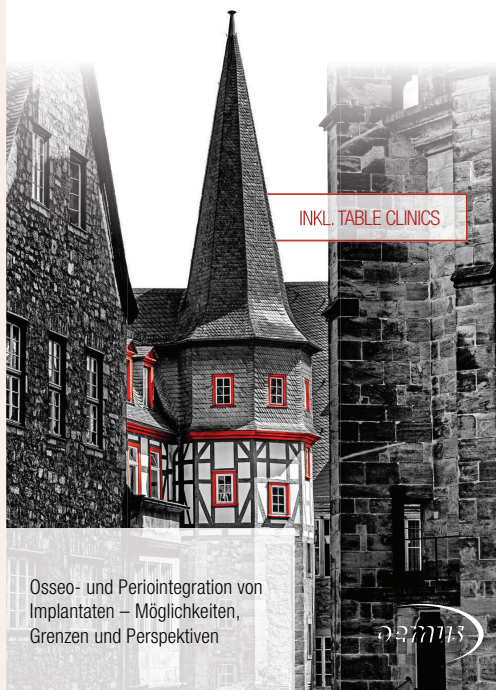
Osseo- und Periintegration von Implantaten – Möglichkeiten, Grenzen und Perspektiven

IMPLANTOLOGY START UP 2021 IMPLANTOLOGIE FÜR EINSTEIGER UND ÜBERWEISERZAHNÄRZTE