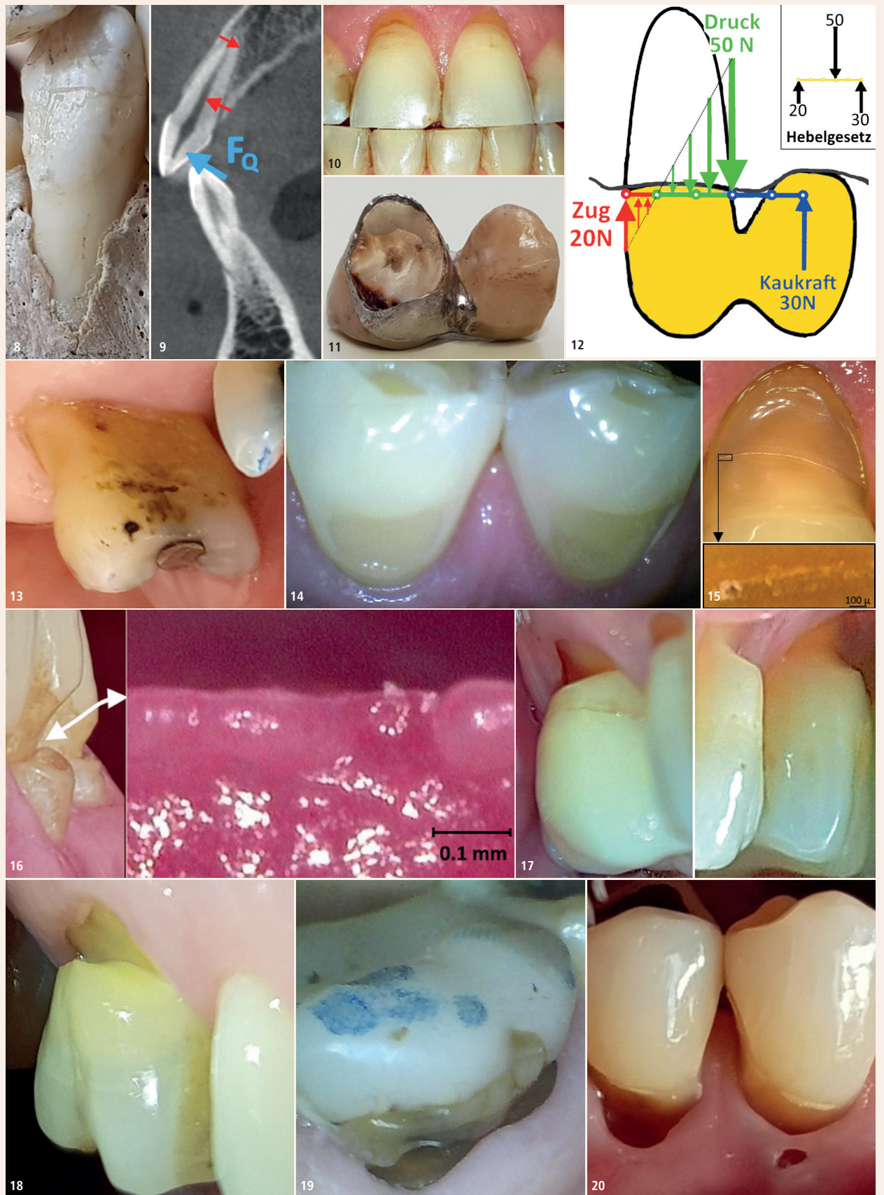
Abb. 8: Die papierdünne Außenwand einer Alveole. – Abb. 9: Die Elastifizierung der Zahnhalsregion durch die Pulpakammern. – Abb. 10: Rezessionen bei 1+1 wegen Attrition. – Abb. 11: Rissbildung im Zahnhals wegen Überlastung. – Abb. 12: Hebelkräfte bei einer Fliegerkrone (Skizze Gabriel Weilenmann, Masch.-Ing., ETH). – Abb. 13: Flacher kaltempfindlicher palatinaler Zahnhalsdefekt. – Abb. 14: Flache symptomlose bukkale Zahnhalsdefekte. – Abb. 15: oben: Beginnende Kerbbildung durch eine Linienkorrosion bei Zahn 4+; unten: Lochfraßkorrosion im Kerbgrund. – Abb. 16: links: Keilförmiger Defekt bei –2; rechts: Impregum-Abdruck des Kerbgrunds mit Zeichen einer Lochfraßkorrosion. – Abb. 17: Tiefe Zahnhalsdefekte bei 65+56 wegen starkem Bruxismus und fehlenden 4+–4. – Abb. 18: Haarriss im Kerbgrund eines vitalen 6+ mit maximalem Abrieb zwischen den beiden Spannungsmaxima des Schmelzrandes und des Kerbgrundes. – Abb. 19: Haarriss im Kerbgrund eines devitalen –6. Der Aufbau wurde 2012 gemacht. Die Patientin kam seither nur noch zur Prophylaxe-Assistentin, welche ihr mehrmals eine sehr gute Mundhygiene attestiert hat. Unter einer Krone wäre der Haarriss kaum sichtbar geworden. – Abb. 20: Gingiva überwächst die Zahnhalsdefekte bei 54–. Man beachte den Zahnstein im Loch der Gingiva.

Im Alter (Patient 76-jährig) nimmt der Schwung beim Zähneputzen ab. Dann erholt sich die Gingiva bei einer Rezession und beginnt nicht selten, über den Zahnhalsdefekt zu wachsen (Abb. 20). D1