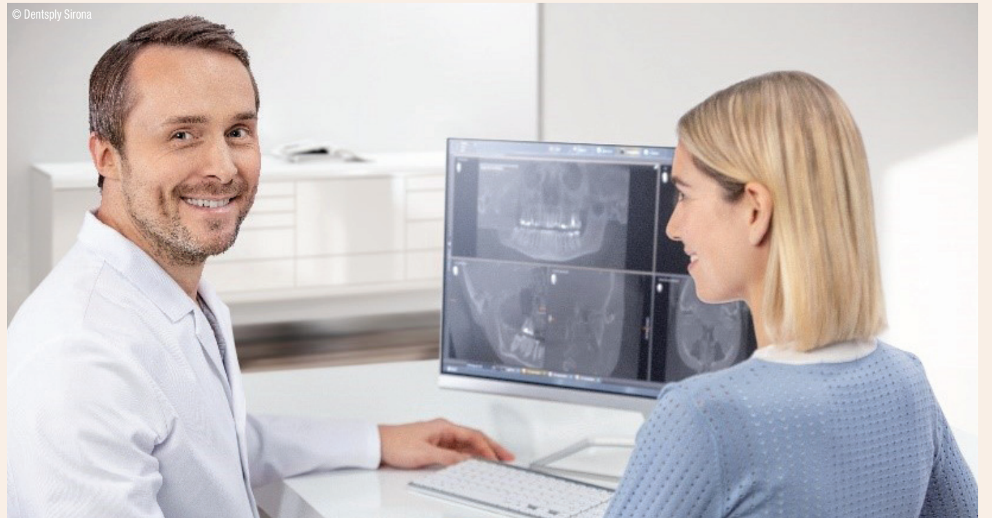
Das grosse Volumen und die ausgezeichnete Bildqualität machen Axeos zu einem professionellen Spezialisten bei der Patientenberatung und bei der Wiederherstellung eines gesunden, glücklichen Lächelns der Patienten.