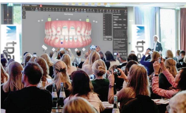
Am 26. und 27. November 2021 findet in Köln der 2. Treatment Planning in Aligner Orthodontics (TPAO)-Kongress statt.

inviSolution GmbH Händelstraße 31 50674 Köln Tel.: +49 221 99409965 www.invisolution.de www.tpao-congress.com