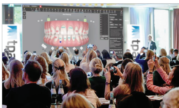
Am 26. und 27. November 2021 findet in Köln der 2. Treatment Planning in Aligner Orthodontics (TPAO)-Kongress statt.

nach diesem Kongress der Vergangenheit an.