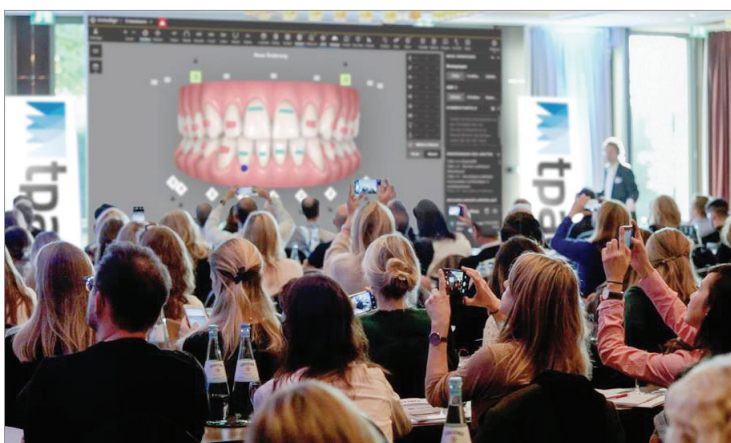
Am 26. und 27. November 2021 findet in Köln der 2. Treatment Planning in Aligner Orthodontics (TPAO)-Kongress statt.

inviSolution GmbH Händelstraße 31 50674 Köln Tel.: +49 221 99409965 www.invisolution.de www.tpao-congress.com