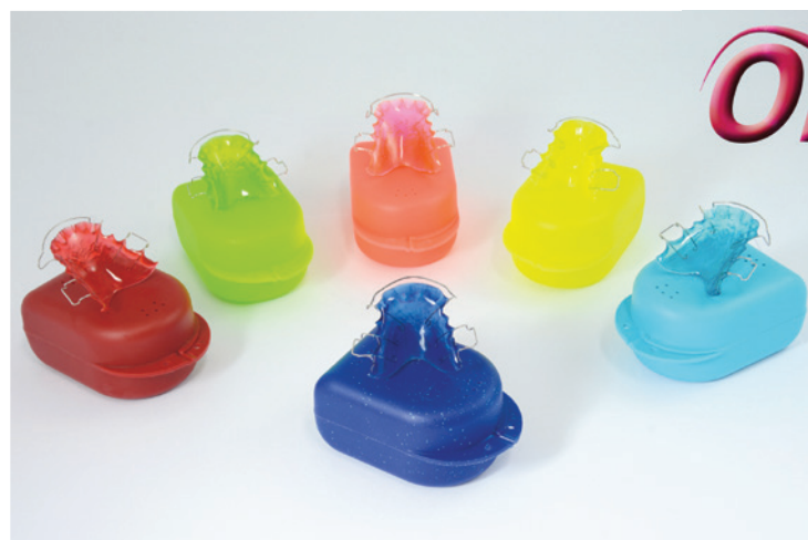
Neonblau (vorn) vervollständigt das Orthocryl® Neonfarben-Portfolio. Die sechs Kunststoffe und Aufbewahrungsboxen sind farblich aufeinander abgestimmt.

Dentaurum Kunststoff jetzt auch in Neonblau erhältlich.