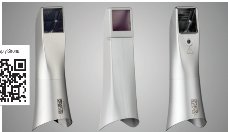
Drei verschiedene Hülsen zur Auswahl für alle Hygieneanforderungen, um sichere Intraoralscans zu gewährleisten (von links): Edelstahlhülse, Einweghülse und die neue autoklavierbare Hülse aus Edelstahl mit Einwegfenster.

Für den Intraoralscanner von Dentsply Sirona ist ab sofort eine autoklavierbare Hülse aus Edelstahl mit Einwegfenster erhältlich.