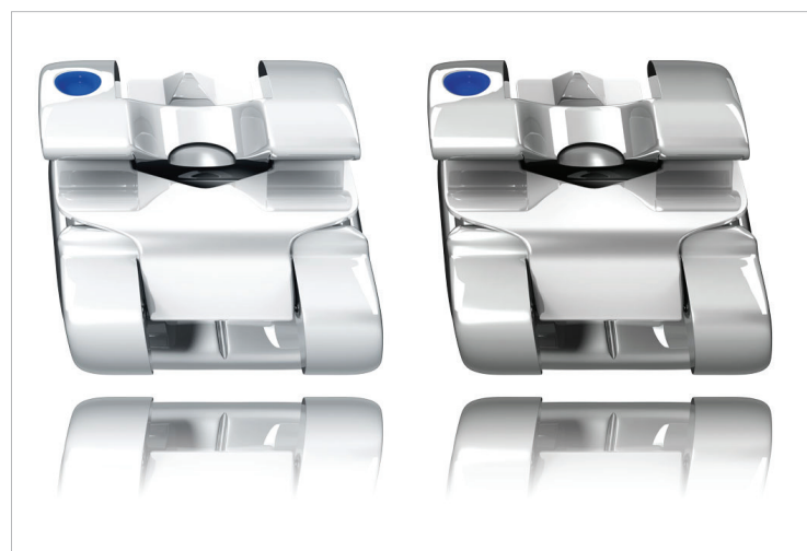
EXPERIENCE Bracket als rhodinierte und klassische Metallvariante.

GC Orthodontics Europe GmbH Harkortstraße 2 58339 Breckerfeld Tel.: +49 2338 801-888 info.gco.germany@gc.dental www.gcorthodontics.eu