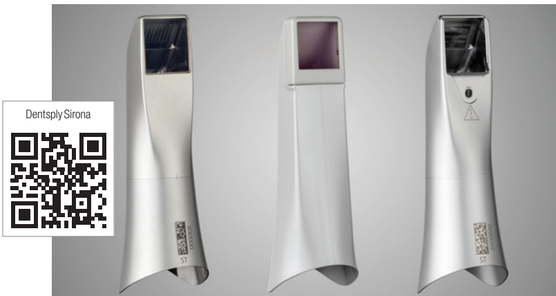
Drei verschiedene Hülsen zur Auswahl für alle Hygieneanforderungen, um sichere Intraoralscans zu gewährleisten (von links): Edelstahlhülse, Einweghülse und die neue autoklavierbare Hülse aus Edelstahl mit Einwegfenster.

Für den Intraoralscanner von Dentsply Sirona ist ab sofort eine autoklavierbare Hülse aus Edelstahl mit Einwegfenster erhältlich.