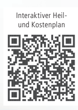
Interaktiver Heil- und Kostenplan

Bei Copyright-Hinweis auf proDente für Zahnärzte und zahntechnische Innungsbetriebe kostenfrei nutzbar.