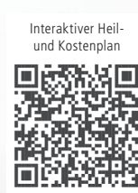
Interaktiver Heil- und Kostenplan

Bei Copyright-Hinweis auf proDente für Zahnärzte und zahntechnische Innungsbetriebe kostenfrei nutzbar.