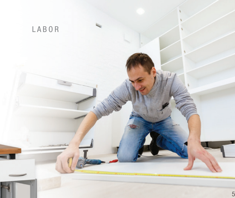
Abb. 5: Beratung, Planung, Fertigung, Montage – alles aus einer Hand.