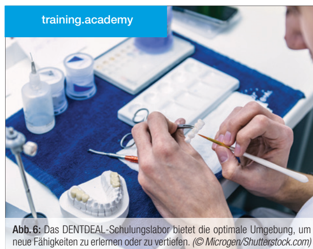
Abb. 6: Das DENTDEAL-Schulungslabor bietet die optimale Umgebung, um neue Fähigkeiten zu erlernen oder zu vertiefen.

Neue Produktentwicklungen und Technologien in der Dentalbranche sind Standard und Beweis für die hohe Kompetenz, die alle Beteiligten in ihr Fachgebiet einbringen. Gerade Zahnärztinnen und Zahnärzte stehen hier nicht stumm daneben, sondern trainieren konsequent neue Fähigkeiten. Das DENTDEAL-Schulungslabor bietet genau hierfür auf 120 Quadratmeter alles, um Produkte in alltäglichen Laborsituationen zu testen oder neue Anwendungstechniken zu erlernen. In Kleingruppen mit bis zu acht Teilnehmenden können in den funktionell eingerichteten Räumen besonders effektive Ergebnisse erzielt werden. DENTDEAL übernimmt die Arbeit im Hintergrund, sodass Zahnärztinnen und Zahnärzte sich auf das Wesentliche konzentrieren können.