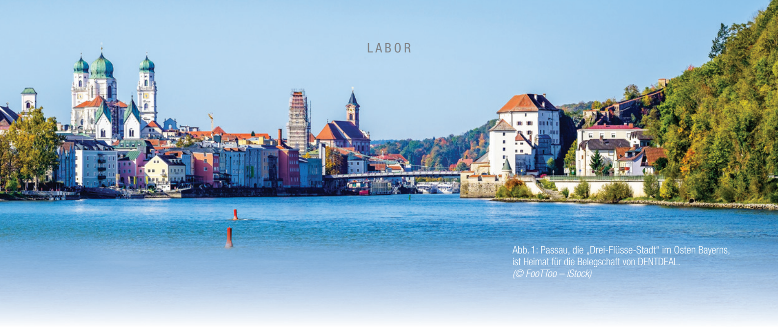
Abb. 1: Passau, die „Drei-Flüsse-Stadt“ im Osten Bayerns, ist Heimat für die Belegschaft von DENTDEAL.

2000 Einen weiteren großen Meilenstein erreicht das Unternehmen zum Jahrtausendwechsel. Der Generalvertrieb in Deutschland und Österreich für MESTRA, Hersteller für alle Laborkategorien und eine echte Preis-Leistungs-Alternative für Neuan-schaffungen, ersetzt schrittweise den Gebrauchtgeräthandel.