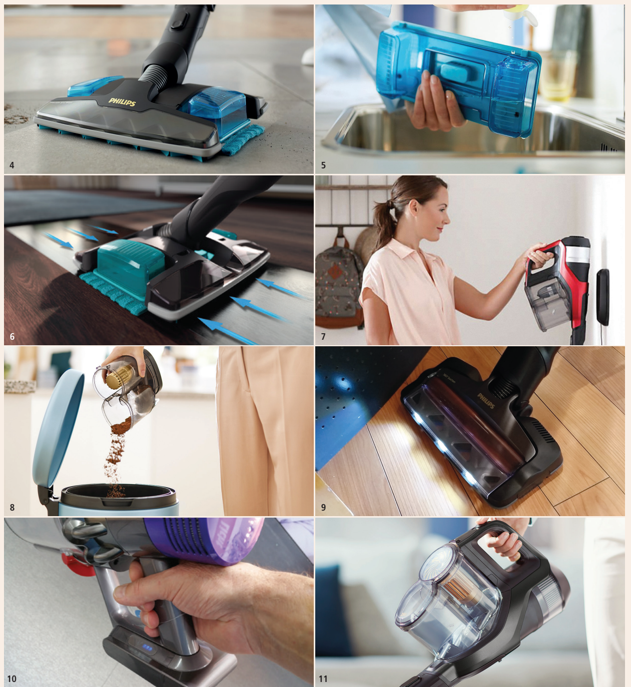
Abb. 4: Staubsaugen und Feucht-Aufnehmen in einem einzigen Arbeitsschritt. – Abb. 5: Der abnehmbare Wassertank wird magnetisch in Position gehalten. – Abb. 6: Die Saugleistung schaltet sich arbeitsrichtungsabhängig automatisch über ein Wippklappensystem von vorne nach hinten um. – Abb. 7: Wandhalterung mit integrierter Ladestation. – Abb. 8: Der Schmutzauffangbehälter lässt sich einfach reinigen und ist so aufgebaut, dass die Schmutzpartikel entfernt vom Zyklonsaugsystem aufgefangen werden. – Abb. 9: Durch die LED-Beleuchtung am Kopf der Saugdüse werden auch kleine Schmutzpartikel gut sichtbar. – Abb. 10: Beispiel einer ergonomisch unvorteilhaften Griffposition: Pistolengriff. – Abb. 11: Signifikant bessere Belastung der Hand.

Das Zubehörsortiment reicht von in das Saugrohr integrierten Saugdüsen mit aufklappbarer Bürste, einer Fugendüse, einem wei-