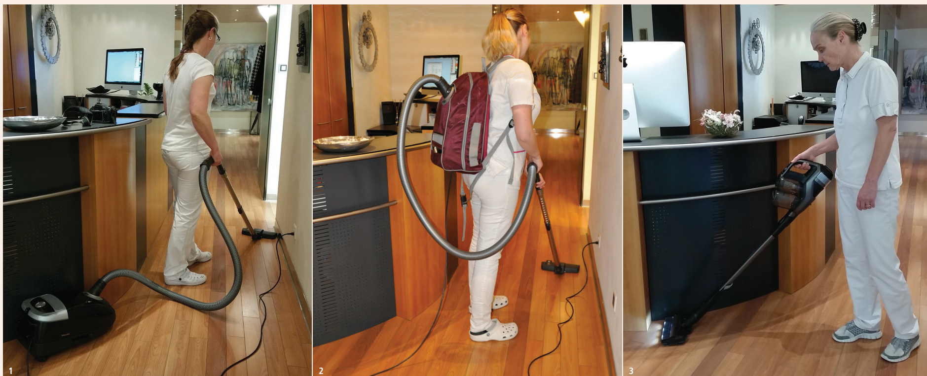
Abb. 1: Konventioneller zweiteiliger Staubsauger. – Abb. 2: Rucksackstaubsauger. – Abb. 3: Akku-Stabstaubsauger.