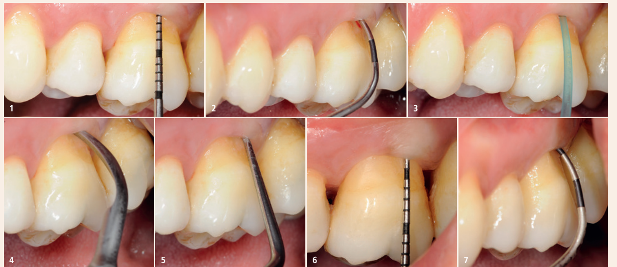
Fall 1 – Abb. 1: Es wurde eine Taschentiefe von 5 mm gemessen. – Abb. 2: Ein Furkationsdefekt Klasse II wurde beobachtet. – Abb. 3: Erste PERISOLV®-Applikation. – Abb. 4: Kürettierung mit einem Ultraschallgerät. – Abb. 5: Eine Wurzelglättung wurde ausgeführt. – Abb. 6: Sechs Monate postoperativ: Reduktion der Taschentiefe auf 3 mm. – Abb. 7: Verbesserung des Furkationsdefekts auf Klasse I mit negativem BOP-Index.

Die ausgeprägte antimikrobielle Wirkung von Chloraminen konnte in mehreren Untersuchungen im Vergleich zu den beiden häufig angewendeten intraoralen Desinfektionsmitteln, Chlorhexidin (CHX) sowie Wasserstoffperoxid, gezeigt werden. Hierbei zeigten sich Chloramine vorteilhaft gegenüber den etablierten Mitteln, insbesondere bei der Inaktivierung von Parodontalpathogenen bei niedrigen Desinfektionsmittelkonzentrationen sowie bei der Inaktivierung eines etablierten Biofilms. 33,34 Bislang erfolgt der klinische Ein-