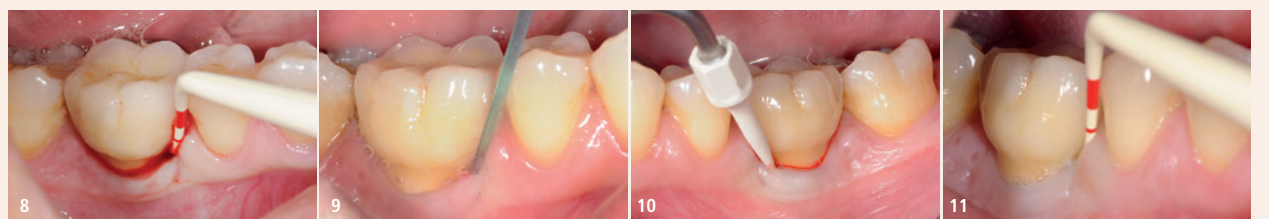
Fall 2 – Abb. 8: Klinische Situation der periimplantären Mukositis: Implantat mit Sondierungstiefe \leq 5 mm und BOP+. – Abb. 9: PERISOLV®-Applikation vor der Behandlung. – Abb. 10: Nichtchirurgische Behandlung – nach einer Einwirkzeit von 30 Sekunden wurde der Biofilm mit einem Ultraschallgerät mit PEEK-Spitze entfernt. – Abb. 11: Sechs Monate postoperativ: Sondierungstiefe \leq 4 mm und negativem BOP-Index.

satz von Chloraminen vor allem bei der Behandlung persistierender entzündlicher Zahntaschen im Rahmen der unterstützenden Parodontitistherapie (UPT). 35