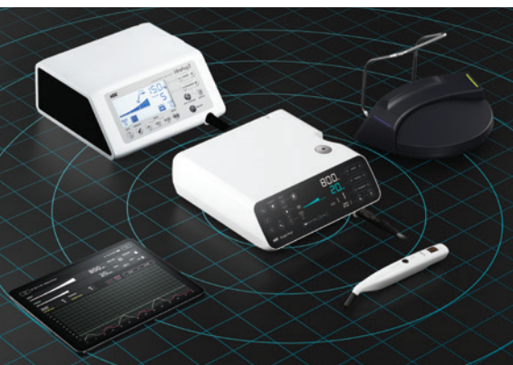
Der Chirurgiemotor Surgic Pro2 bietet erweiterte Funktionen und eine Vernetzungsmöglichkeit mit weiteren Geräten.

Surgic Pro2 bietet Vernetzungsmöglichkeiten zu weiteren Geräten. Es ist daher möglich, Patientendaten digital zu speichern und auszuwerten.