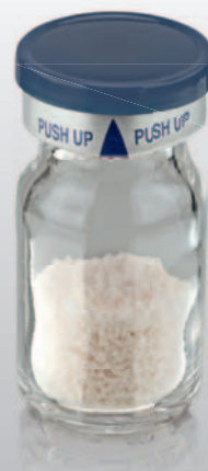
naturesQue SemOss B Xenohybrides bovines Knochenersatzmaterial

33,3% Preisvorteil Jetzt „2+1“ bestellen* Service-Hotline 0421-2028-246