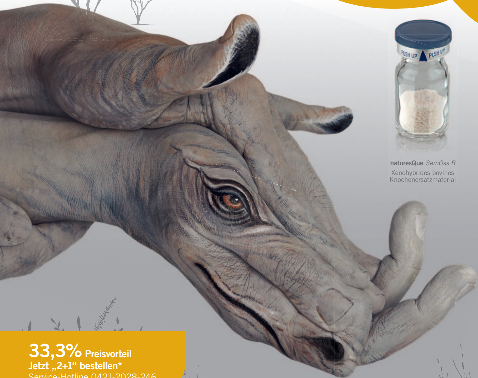
naturesQue SemOss B Xenohybrides bovines Knochenersatzmaterial

33,3% Preisvorteil Jetzt „2+1“ bestellen* Service-Hotline 0421-2028-246