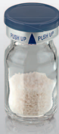
naturesQue SemOss B Xenohybrides bovines Knochenersatzmaterial

33,3% Preisvorteil Jetzt „2+1“ bestellen* Service-Hotline 0421-2028-246