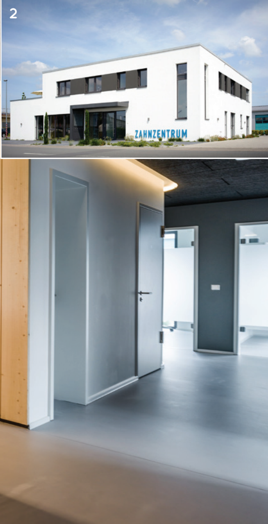
Abb. 2: Das klare, frische Design spiegelt sich auch am Gebäude wider.

Bereits im Zuge des ZWP Designpreises 2018 fiel das Zahnzentrum Riedstadt (Abb. 1) aufgrund seines natürlichen und unkonventionellen Designs der Praxisräume auf 560 Quadratmetern ins Auge und schaffte es bei fast 70 Teilnehmern unter die zehn schönsten Zahnarztpraxen Deutschlands.