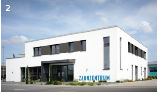
Abb. 2: Das klare, frische Design spiegelt sich auch am Gebäude wider.