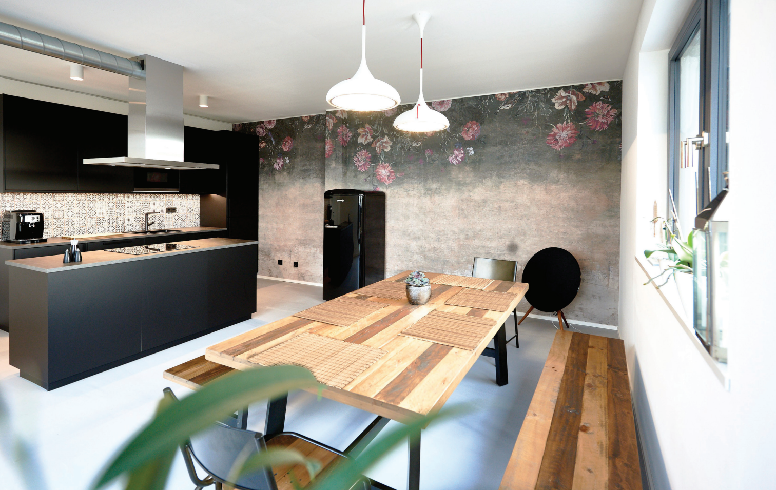
Abb. 7: Der großzügige Aufenthaltsraum: Platz für Austausch, Teamzusammengehörigkeit und frisch gekochte Mittagessen.

Flache Hierarchien sowie auch als Vorgesetzte immer ein Ohr für die Probleme der Mitarbeiter zu haben, auch wenn diese einmal nicht praxisbezogen sind, stellen weitere wichtige Komponenten des Praxiskonzeptes dar. Dazu gehört ebenso, ein gesundes Mittagessen für die Mitarbeiter zur Verfügung zu stellen und Platz für Austausch und Teamzusammengehörigkeit zu schaffen. Die Mittagessen werden normalerweise im großzügigen Aufenthaltsraum täglich frisch gekocht und gemeinsam eingenommen (Abb. 7). Hoffentlich kann nach Corona zu dieser bewährten Tradition zurückgekehrt werden.