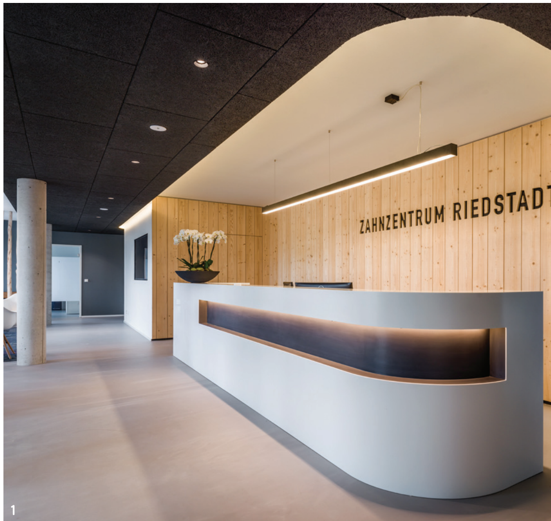
Abb. 1: Die Praxisräume verbinden natürliche und unkonventionelle Details.