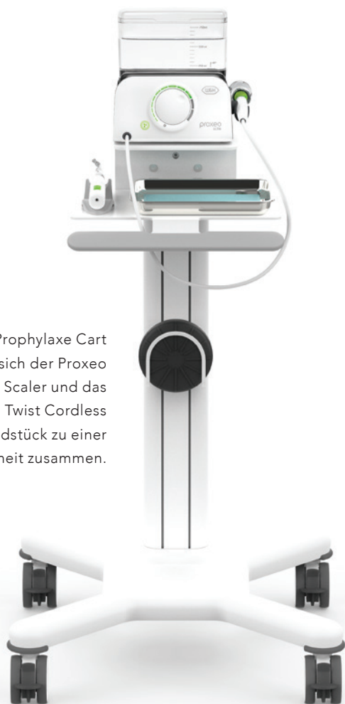
Im Prophylaxe Cart schließen sich der Proxeo Ultra Piezo Scaler und das Proxeo Twist Cordless Handstück zu einer Einheit zusammen.

Uns liegt es sehr am Herzen, die Fortbildung im Bereich der Prophylaxe zu unterstützen, dafür haben wir einen umfangreichen Pool an Kursgeräten, die fast wöchentlich im Einsatz sind. Unter dem Namen „Individual