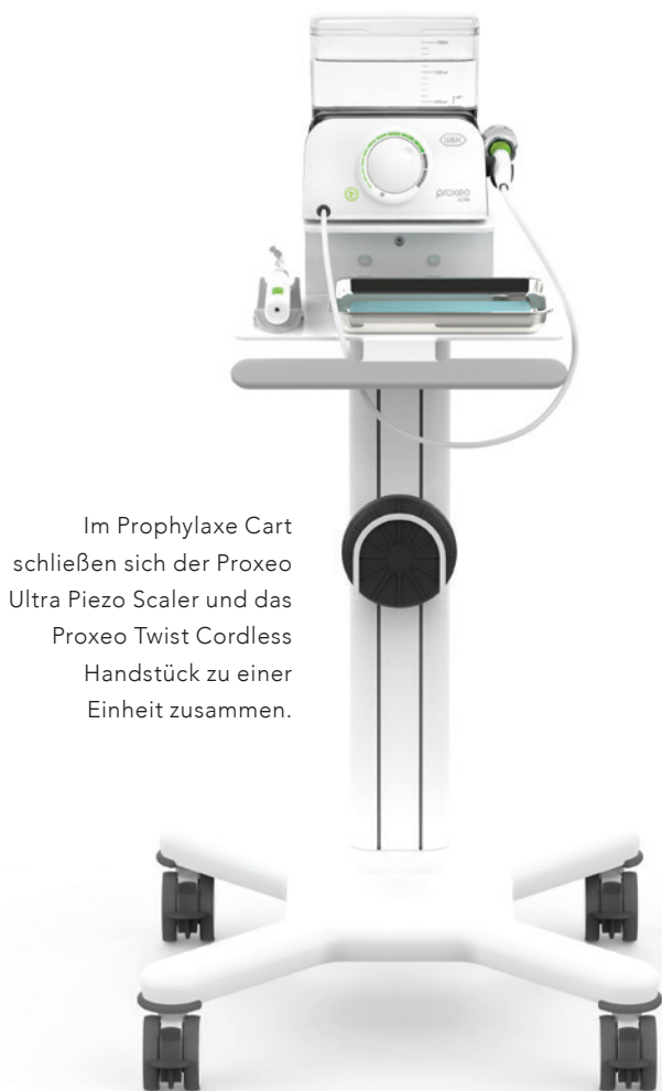
Im Prophylaxe Cart schließen sich der Proxeo Ultra Piezo Scaler und das Proxeo Twist Cordless Handstück zu einer Einheit zusammen.

Uns liegt es sehr am Herzen, die Fortbildung im Bereich der Prophylaxe zu unterstützen, dafür haben wir einen umfangreichen Pool an Kursgeräten, die fast wöchentlich im Einsatz sind. Unter dem Namen „Individual