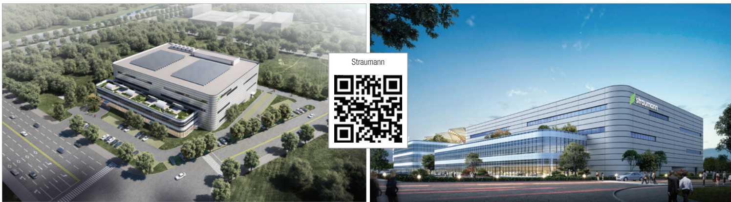
So wird der China Campus der Straumann Group nach Fertigstellung aussehen.

Unternehmensgruppe errichtet ihr erstes Produktions-, Ausbildungs- und Innovationszentrum.