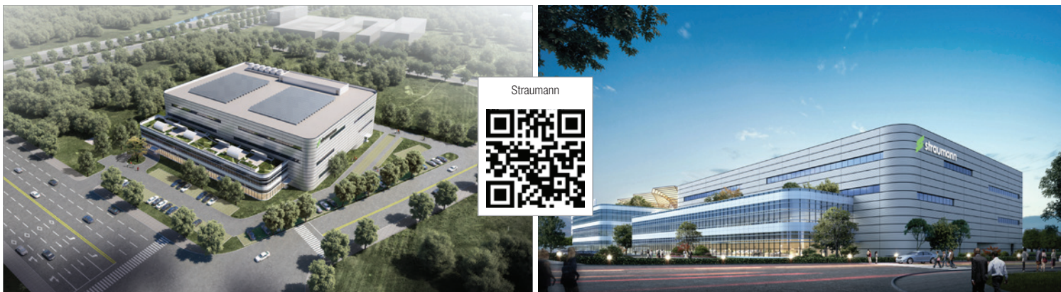
So wird der China Campus der Straumann Group nach Fertigstellung aussehen.

Unternehmensgruppe errichtet ihr erstes Produktions-, Ausbildungs- und Innovationszentrum.