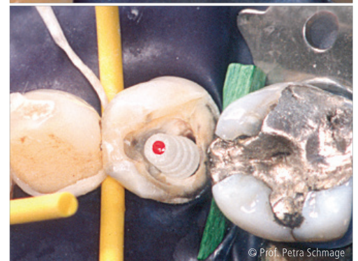
Abb. 1: Eingepasster und koronal eingekürzter glasfaserverstärkter Kompositstift (hier: DentinPost Coated, Komet Dental). – Abb. 2: Auflage des Stiftkopfs eines Kopfstifts aus faserverstärktem Komposit am Kavitätenboden. Die Defektausdehnung erlaubte die Positionierung des Stiftkopfs ohne zusätzliche Substanzentfernung.