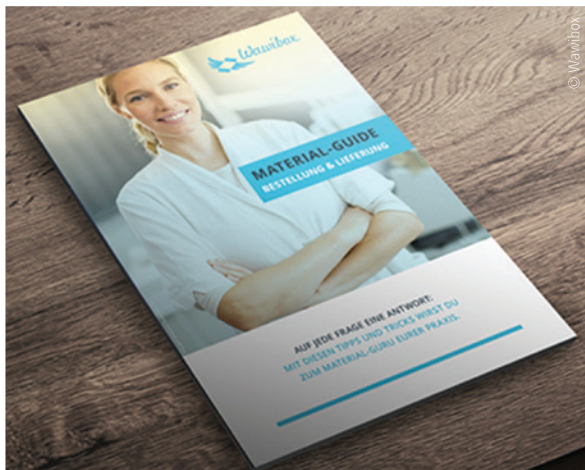
Abb. 2: Der Material-Guide von Wawibox.

Bei Fragen können über die Website www.wawibox.de kostenfreie Beratungsgespräche vereinbart werden.