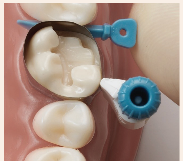
Palodent 360: Das einfach zu bedienende Matrizensystem für Restaurationen der Klasse II.

Spannmechanismus ist mithilfe eines Daumenrades einfach zu bedienen, für einen hervorragenden Zugang und optimale Sicht auf den Arbeitsbereich bei gleichzeitig hohem Patientenkomfort.