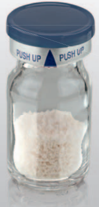
naturesQue SemOss B Xenohybrides bovines Knochenersatzmaterial

33,3% Preisvorteil Jetzt „2+1“ bestellen* Service-Hotline 0421-2028-246