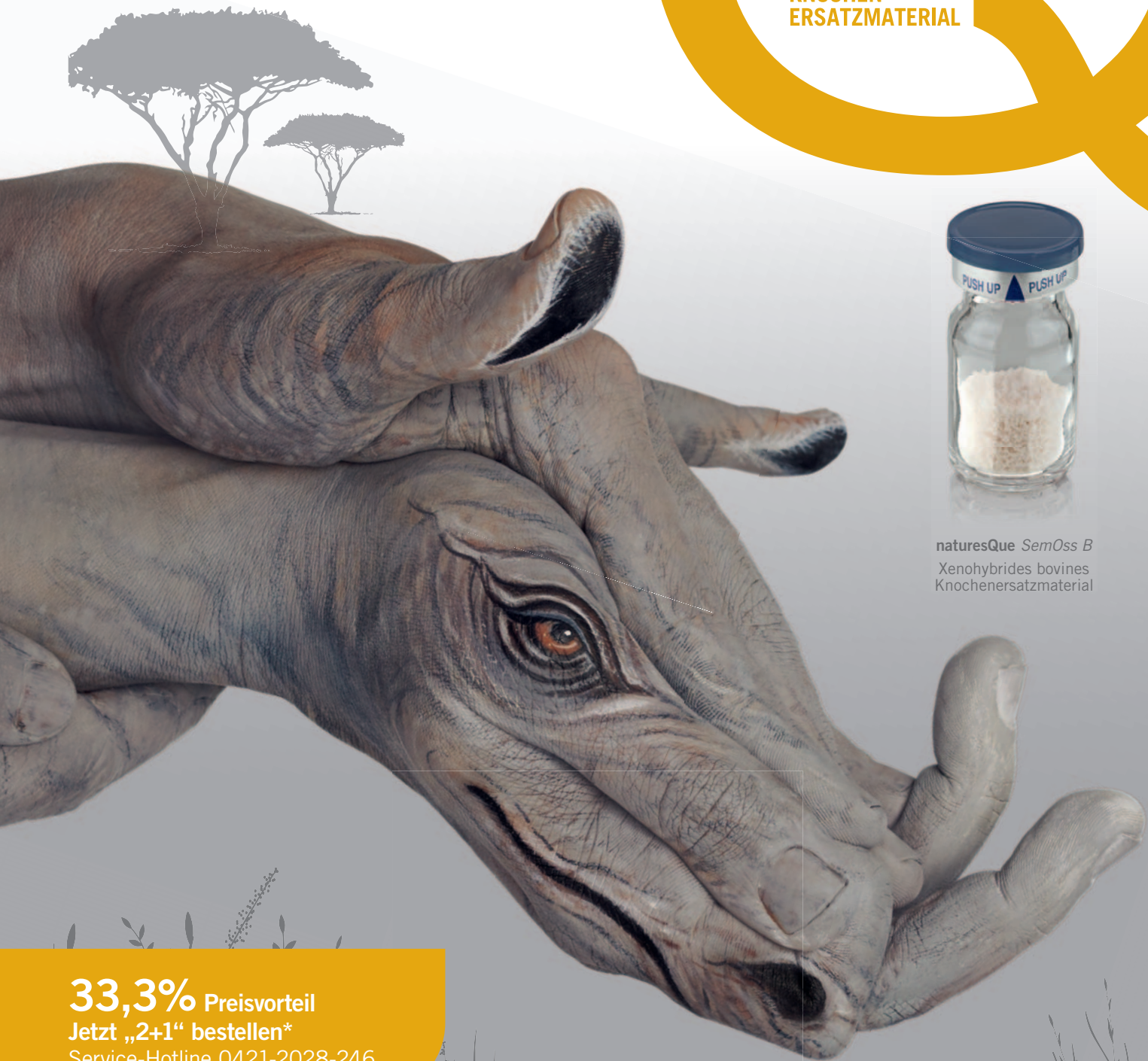
naturesQue SemOss B Xenohybrides bovines Knochenersatzmaterial

33,3% Preisvorteil Jetzt „2+1“ bestellen* Service-Hotline 0421-2028-246