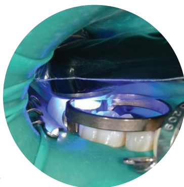
Abb. 1: Die schlanke Form und der niedrige Leuchtenkopf ermöglichen auch im Bereich der hinteren Seitenzähne eine suffiziente Polymerisation.

Bei unserer Praxisübernahme im Jahr 2010 stand die Frage im Raum, für welche Polymerisationslampe wir uns entscheiden sollen. Eine Lampe mit LEDs als Lichtquelle wurde vor allem wegen der geringeren Wärmeentwicklung und der längeren Lebensdauer bevorzugt. Relativ schnell fiel die Wahl auf die VALO™ Polymerisationsleuchte – damals wie erwähnt nur mit Kabel erhältlich. Jedoch würde die Entscheidung heutzutage vermutlich nicht anders ausfallen, da das Kabel im Alltag weder vom Behandler noch von der Assistenz als störend empfunden wird. Es ist verhältnismäßig dünn und dadurch leicht und sehr flexibel. Darüber hinaus ist die kabelgebundene Variante auf-