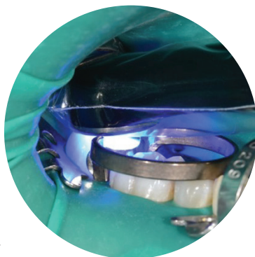
Abb. 1: Die schlanke Form und der niedrige Leuchtenkopf ermöglichen auch im Bereich der hinteren Seitenzähne eine suffiziente Polymerisation.

Bei unserer Praxisübernahme im Jahr 2010 stand die Frage im Raum, für welche Polymerisationslampe wir uns entscheiden sollen. Eine Lampe mit LEDs als Lichtquelle wurde vor allem wegen der geringeren Wärmeentwicklung und der längeren Lebensdauer bevorzugt. Relativ schnell fiel die Wahl auf die VALO™ Polymerisationsleuchte – damals wie erwähnt nur mit Kabel erhältlich. Jedoch würde die Entscheidung heutzutage vermutlich nicht anders ausfallen, da das Kabel im Alltag weder vom Behandler noch von der Assistenz als störend empfunden wird. Es ist verhältnismäßig dünn und dadurch leicht und sehr flexibel. Darüber hinaus ist die kabelgebundene Variante auf-