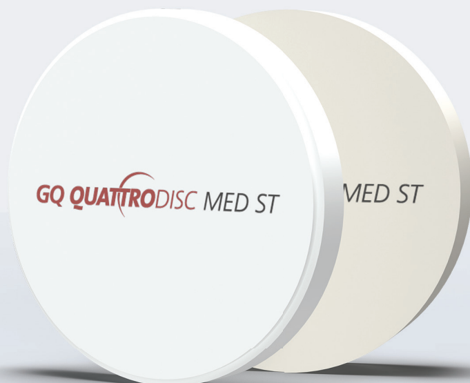
Abb. 1: Das Zirkonoxid GQ Quattro Disc Med ST von Gold Quadrat.

Einzelkronen, kleine Brücken und selbst weitspannige Restaurationen oder Abutments können aufgrund der hohen Biegefestigkeit problemlos umgesetzt werden.