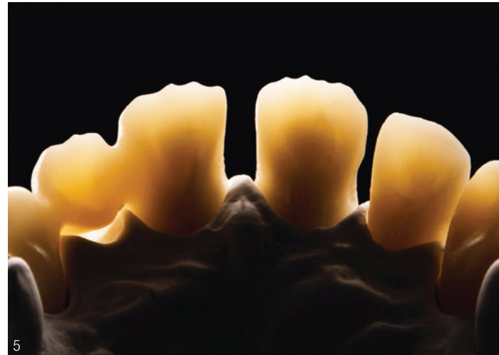
Abb. 2 bis 4: GQ Quattro Disc Med ST und die vielseitige Anwendung: Gerüste zum Verblenden im ästhetisch relevanten Bereich sowie monolithische Versorgung im Seitenzahnbereich. Abb. 5: Die Gerüstkronen im Durchlicht zeigen die eindrucksvolle Lichtoptik.

duell charakterisieren. Einzelkronen, kleine Brücken und selbst weitspannige Restaurationen oder Abutments können aufgrund der hohen Biegefestigkeit problemlos umgesetzt werden.