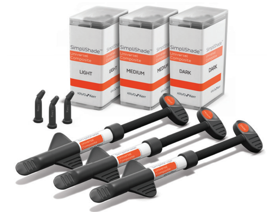
Abb. 1: Das SimpliShade™ Universal Composite deckt mit nur drei Farbtönen alle 16 VITA-Farbtöne ab.