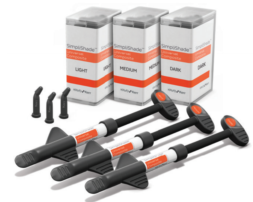
Abb. 1: Das SimpliShade™ Universal Composite deckt mit nur drei Farbtönen alle 16 VITA-Farbtöne ab.