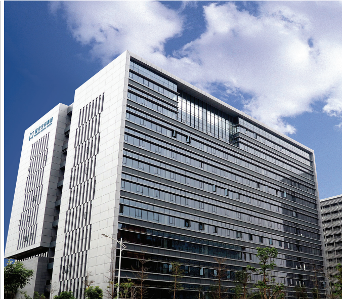
Abb. links: Zum umfassenden Servicenetzwerk der Modern Dental Group gehört auch PERMADENTAL. Abb. rechts: Laborgebäude der Modern Dental Group in Dongguan, Provinz Guangdong.

Die Modern Dental Group als multinational aktives Unternehmen betreut global mehr als 23.000 Praxen, verfügt allein in China über 20 Verkaufsstellen und ist in Europa, Amerika und Australien mit über 50 Servicecentern und regionalen Produktionsstätten vertreten. Mit seinem umfassenden Servicenetzwerk bietet die Gruppe, zu der auch PERMADENTAL gehört, seit nun-