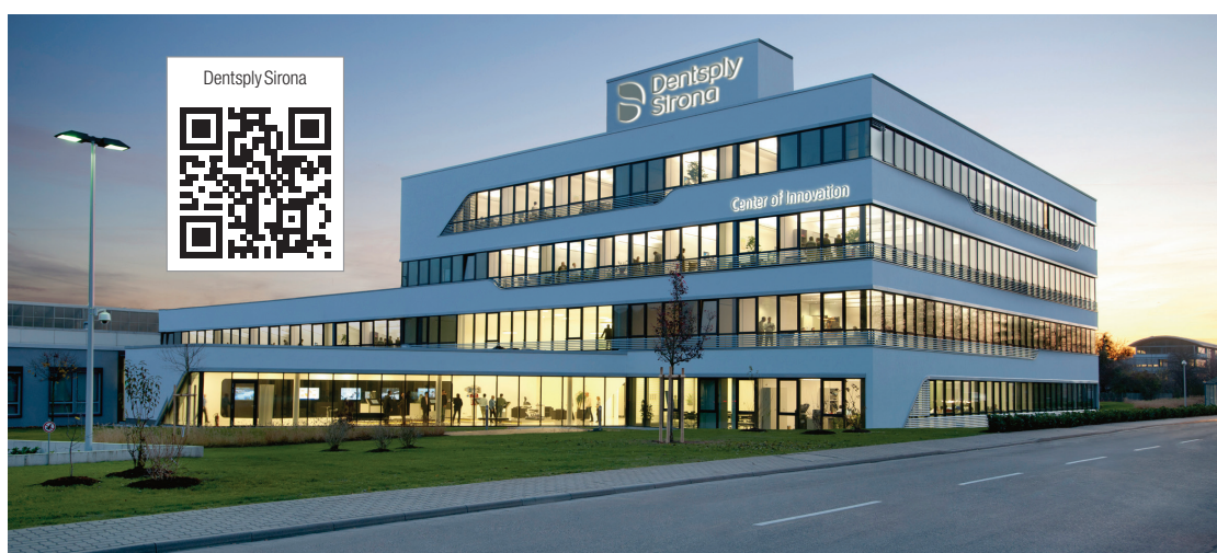
Dentsply Sirona Innovation Center in Bensheim, Deutschland.

Dentsply Sirona Deutschland GmbH Fabrikstraße 31 64625 Bensheim Tel.: +49 6251 16-0 contact@dentsplysirona.com www.dentsplysirona.com