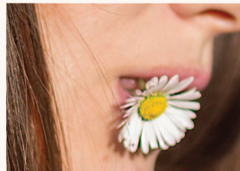
Die „Wirkung“ Mund-Wund-Pflaster

Mundentzündungen gehen oft mit Schmerzen einher und entstehen etwa durch Infektionen, Verletzungen oder Stress. Mundschleimhäute heilen meist schnell, doch ist Essen und Trinken in der akuten Phase unangenehm.