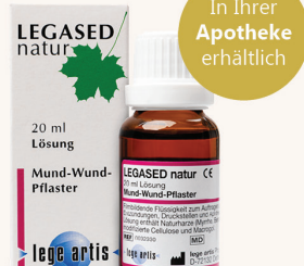
Die Naturharzlösung LEGASED natur