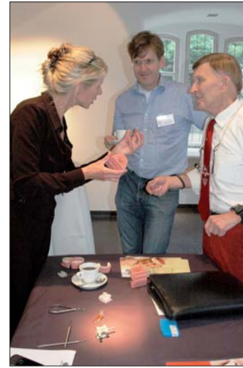
In der parallelen Ausstellung einzelner Firmen der Dentalindustrie konnte sich über neueste Produkte und Materialien informiert werden.

IOS Hannover Kirchröder Str. 77 30625 Hannover Tel.: 05 11/55 44 77 Fax: 05 11/55 01 55 E-Mail: ios@raiman.de www.ios-hannover.de