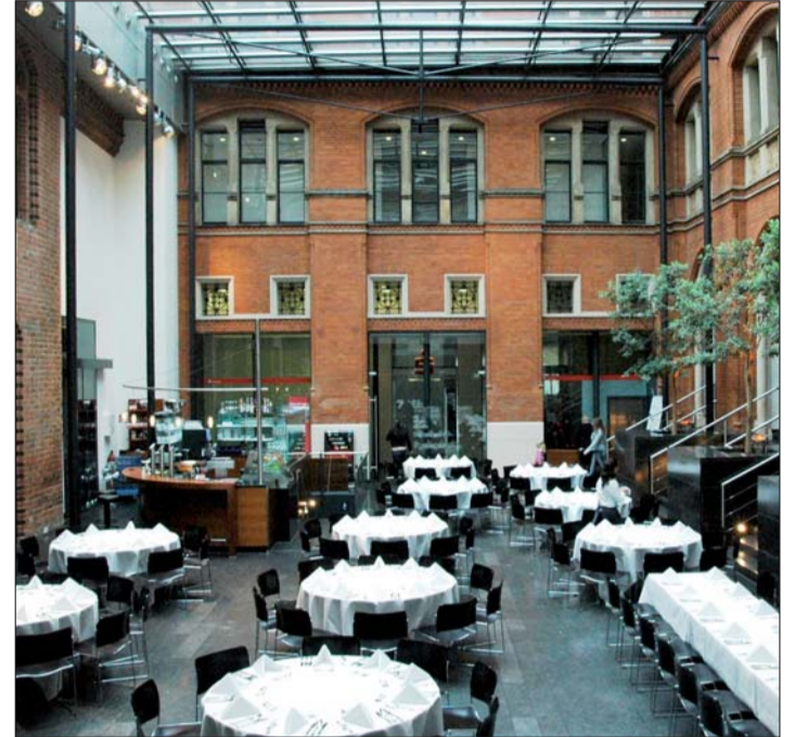
Veranstaltungsort war das Alte Rathaus von Hannover.