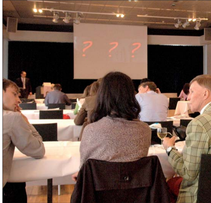
„Interdisziplinäres Management des anterioren ästhetischen Dilemmas“ lautete der Titel dieser Tagesveranstaltung, welche den Teilnehmern u. a. verschiedene Behandlungsansätze aufzeigte.