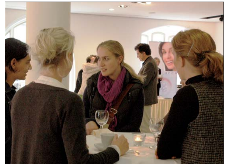
In den Pausen konnten Erfahrungen unter Kollegen ausgetauscht werden.