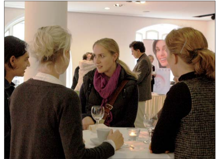
In den Pausen konnten Erfahrungen unter Kollegen ausgetauscht werden.