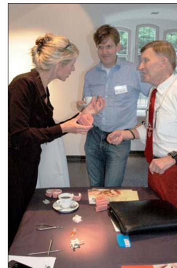
In der parallelen Ausstellung einzelner Firmen der Dentalindustrie konnte sich über neueste Produkte und Materialien informiert werden.

IOS Hannover Kirchröder Str. 77 30625 Hannover Tel.: 05 11/55 44 77 Fax: 05 11/55 01 55 E-Mail: ios@raiman.de www.ios-hannover.de