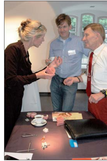
In der parallelen Ausstellung einzelner Firmen der Dentalindustrie konnte sich über neueste Produkte und Materialien informiert werden.

IOS Hannover Kirchröder Str. 77 30625 Hannover Tel.: 05 11/55 44 77 Fax: 05 11/55 01 55 E-Mail: ios@raiman.de www.ios-hannover.de