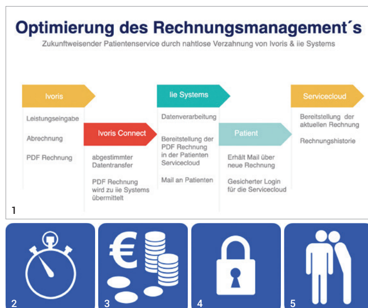
Abb. 1: Rechnungsversand, -empfang und -verarbeitung erfolgen direkt aus ivoris und ersetzen bzw. ergänzen den tradierten Papierdruck. Abb. 2: Durch die Online-Zustellung werden die Rechnungsempfänger in Echtzeit erreicht. Abb. 3: Einsparung von Geld sowie natürlichen Ressourcen. Abb. 4: Schutz personenbezogener Daten laut DSGVO. Abb. 5: Guter Service spricht sich rum. Abb. 6: Deutlich weniger Stress für Patienten und deren Eltern.

In der Servicecloud können Eltern die Arztrechnungen für die gesamte Familie managen. Nach dem Log-in werden alle in kieferorthopädischer Behandlung befindlichen Kinder übersichtlich angezeigt und geordnet. Einfacher geht es nicht (Abb. 8).