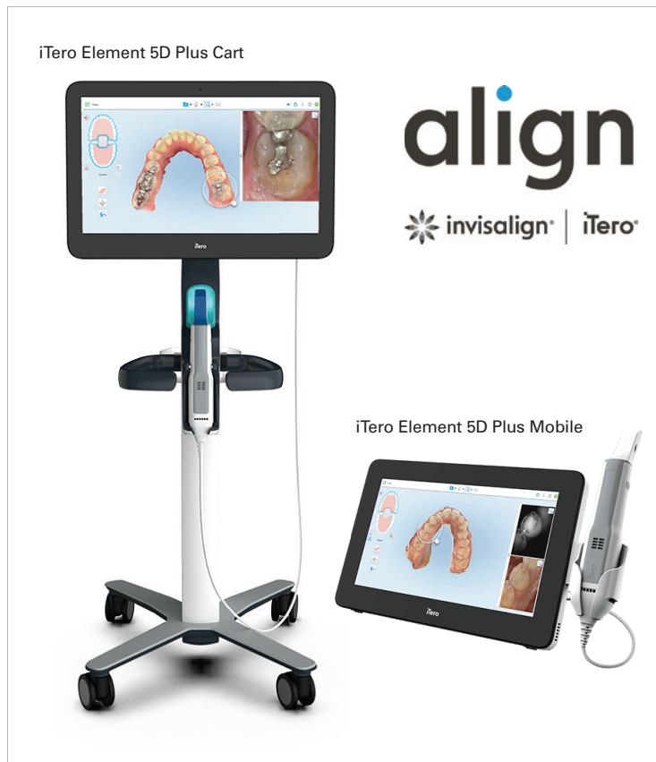
Die neue iTero Element Plus Serie ist sowohl als Wagen- als auch als mobile Konfiguration erhältlich und bietet somit mehr Flexibilität und Mobilität.

Die nächste Generation der Scanner und Bildgebungssysteme.