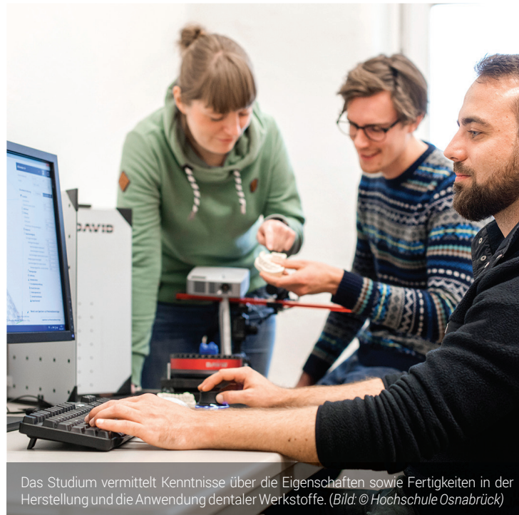
Das Studium vermittelt Kenntnisse über die Eigenschaften sowie Fertigkeiten in der Herstellung und die Anwendung dentaler Werkstoffe.

Studium bildet Brücke zwischen Zahntechnik, Zahnmedizin und Materialwissenschaft.