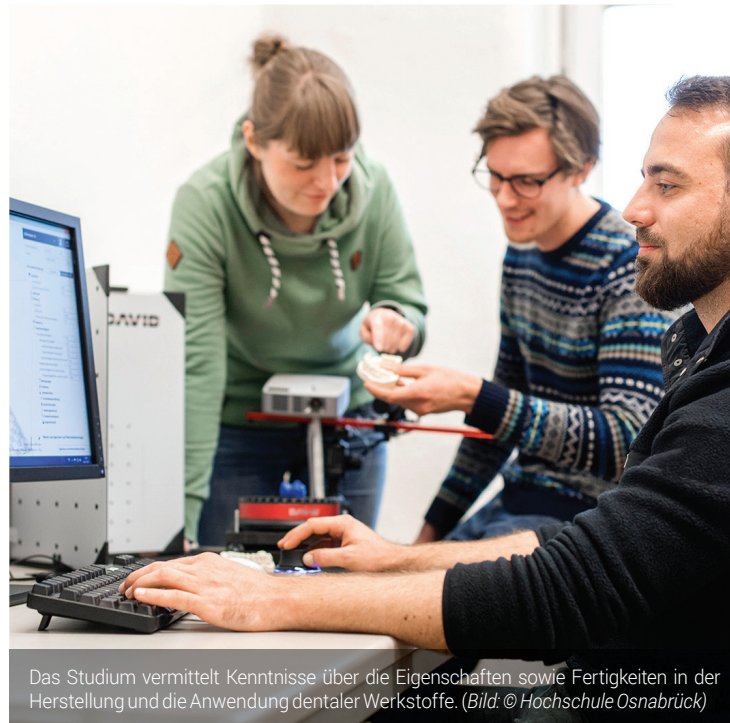
Das Studium vermittelt Kenntnisse über die Eigenschaften sowie Fertigkeiten in der Herstellung und die Anwendung dentaler Werkstoffe.

Studium bildet Brücke zwischen Zahntechnik, Zahnmedizin und Materialwissenschaft.