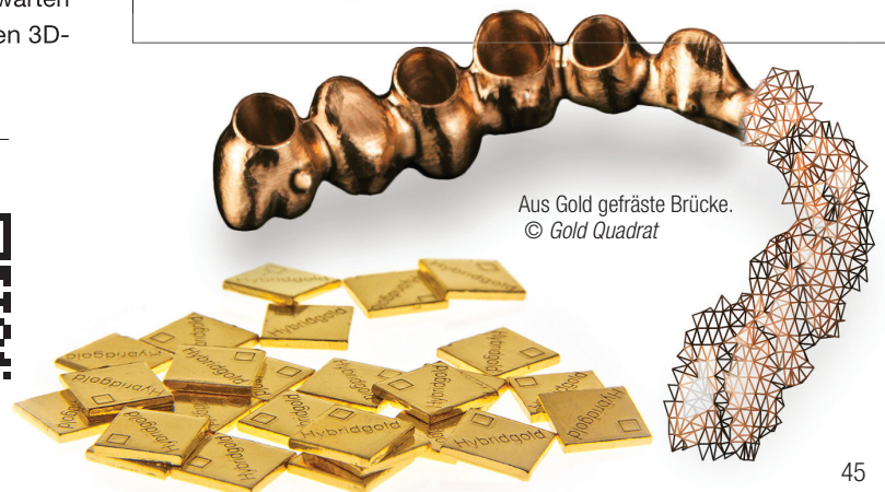
Aus Gold gefräste Brücke. © Gold Quadrat