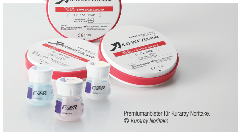
Premiuanbieter für Kuraray Noritake.