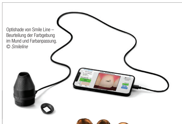
Optishade von Smile Line – Beurteilung der Farbgebung im Mund und Farbanpassung.