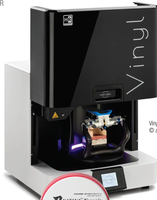
Vinyl High Resolution.

Besonders gefragt sind die regelmäßigen Kurse und Workshops rund um die moderne Zahntechnik, die Gold Quadrat mit seinen Partnern organisiert. Das nächste Highlight: Der User Day 2021 am 4. September im Formlabs Office in Berlin. Hier erwarten die Teilnehmer vielfältige Infos rund um den dentalen 3D-Druck – jetzt online anmelden!