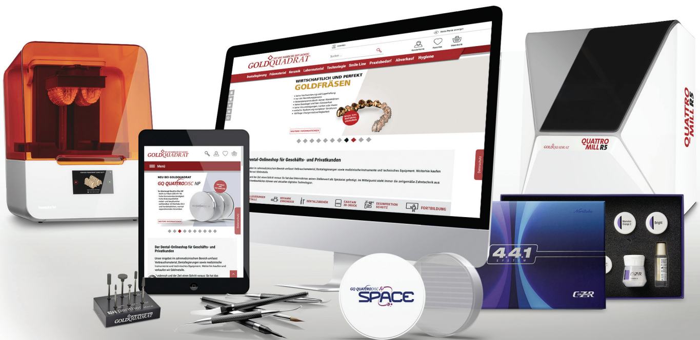
Gold Quadrat, Formlabs, Smile Line, SUN, vhf, Kuraray Noritake.

PORTFOLIO /// Zahntechnikerinnen und Zahntechniker stellen sich täglich analogen und digitalen Anforderungen. Kompetenter Support ist auf beiden Ebenen gefragt, um die Arbeit so angenehm und effizient wie möglich zu gestalten. Gold Quadrat setzt hier seit über 15 Jahren Maßstäbe.