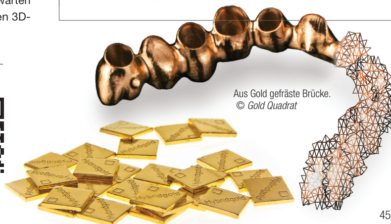
Aus Gold gefräste Brücke.