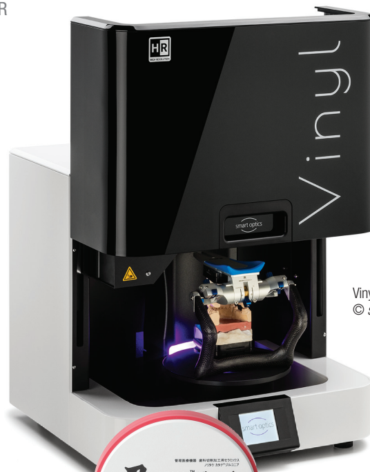
Vinyl High Resolution.

Besonders gefragt sind die regelmäßigen Kurse und Workshops rund um die moderne Zahntechnik, die Gold Quadrat mit seinen Partnern organisiert. Das nächste Highlight: Der User Day 2021 am 4. September im Formlabs Office in Berlin. Hier erwarten die Teilnehmer vielfältige Infos rund um den dentalen 3D-Druck – jetzt online anmelden!