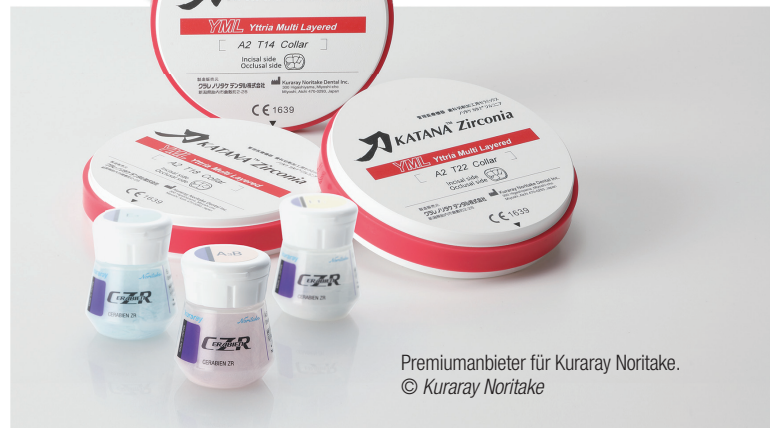
Premiuanbieter für Kuraray Noritake.