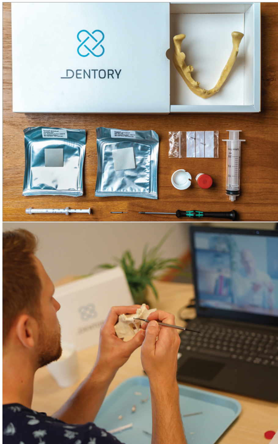
Abb. 3: Unboxing. – Abb. 4: Smartes Online-Live-Training.

Natürlich setzen wir unser erfolgreiches Projekt weiter fort. Ich glaube, auch wenn jetzt wieder mehr Präsenzveranstaltungen stattfinden dürfen und selbstverständlich der direkte soziale Austausch auf Kongressen und Kursen wieder gesucht wird, so hat die Pandemiezeit doch gezeigt: smartes Online-Live-Training funktioniert – und das auch noch richtig gut! Die Chapterstruktur wird toll angenommen, wir haben gerade frisch ein „Cross Training“ etabliert. Hierbei können fünf Kurse aus den unterschiedlichen Chapters gewählt werden – für die Generalisten unter uns, die dentalen Zahnkämpfer, vor deren Wissen und Leistung ich wirklich hohen Respekt habe, und weitere spannende Ideen sind in der Pipeline. Daher sind wir sehr guter Dinge, dass ePractice32 als hocheffizientes und spannendes Fortbildungsangebot weiter gedeihen und wachsen wird.