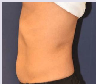
Nach 4 Wochen 1 truSculpt iD Behandlung & 4 truSculpt Flex Behandlungen